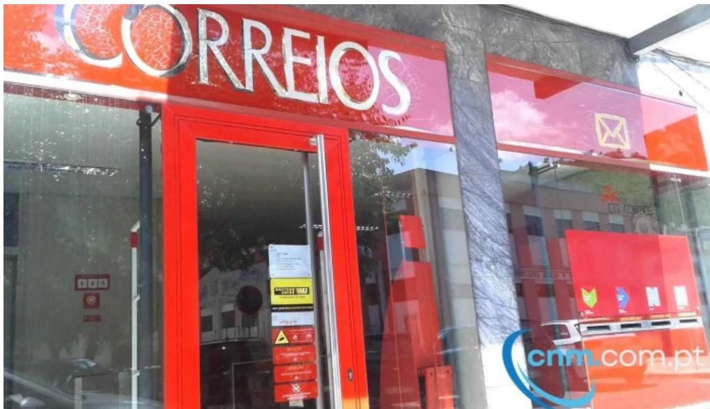
Loja ctt exterior