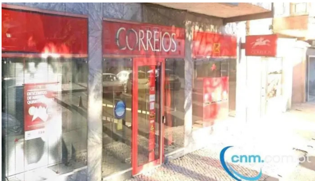
Loja ctt alenquer