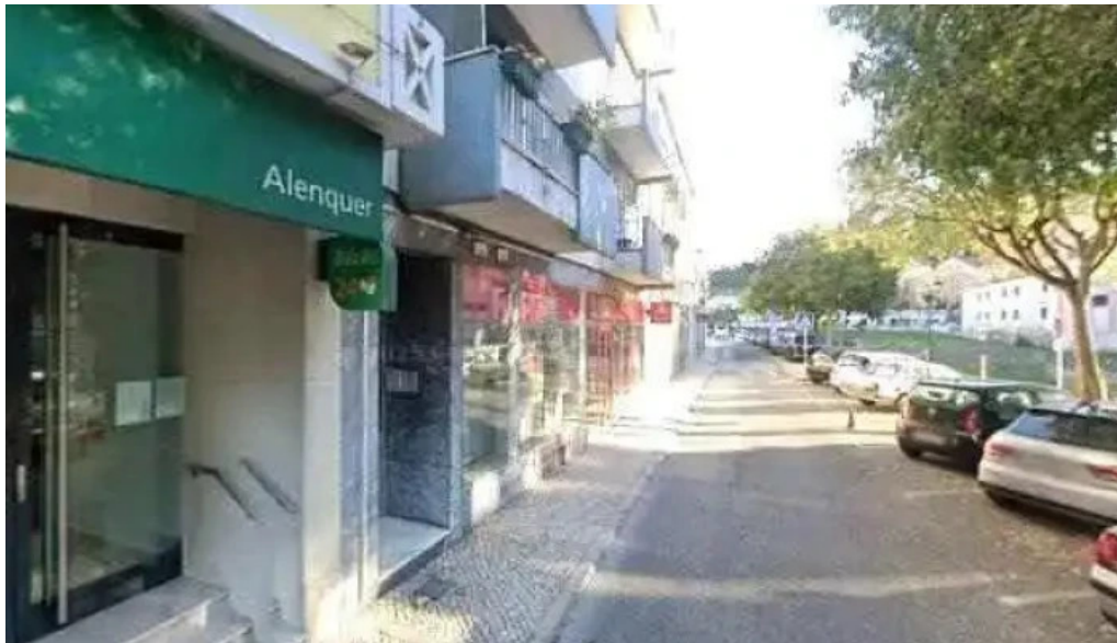
Loja ctt street view e 360deg