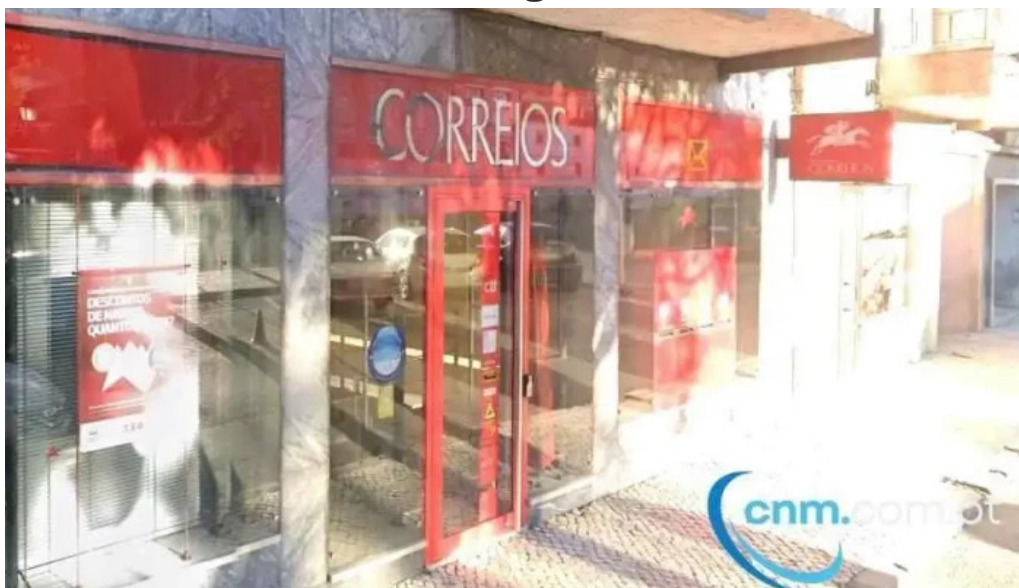
Loja ctt tudo