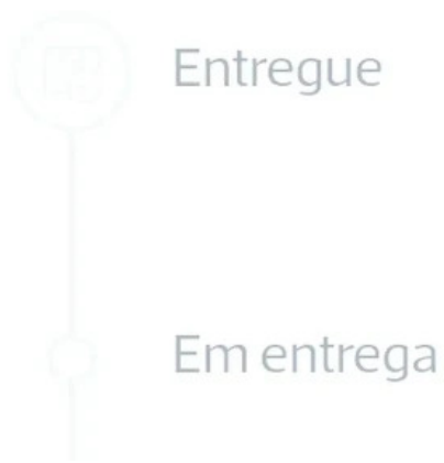
Loja ctt correios