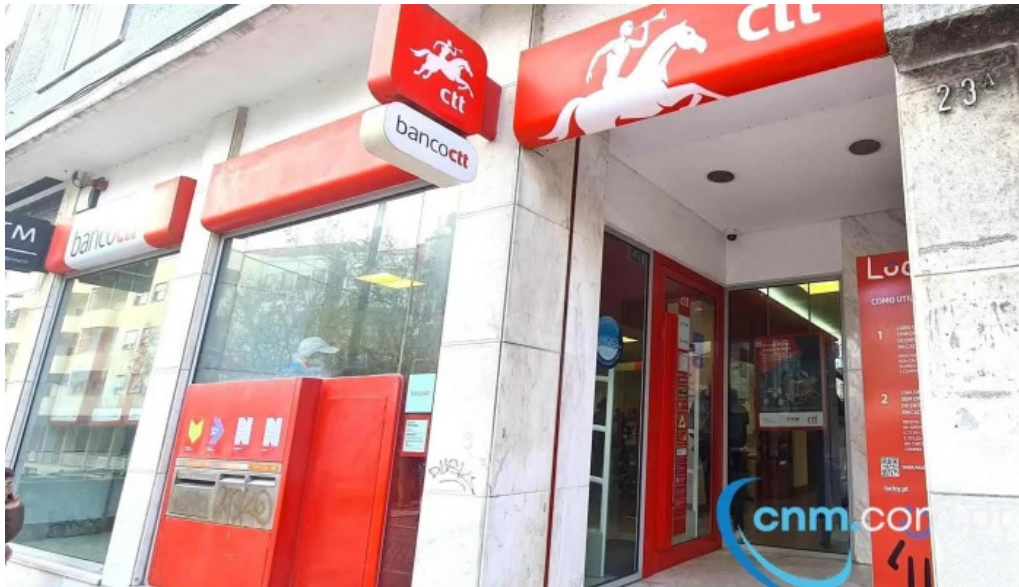
Loja ctt tudo