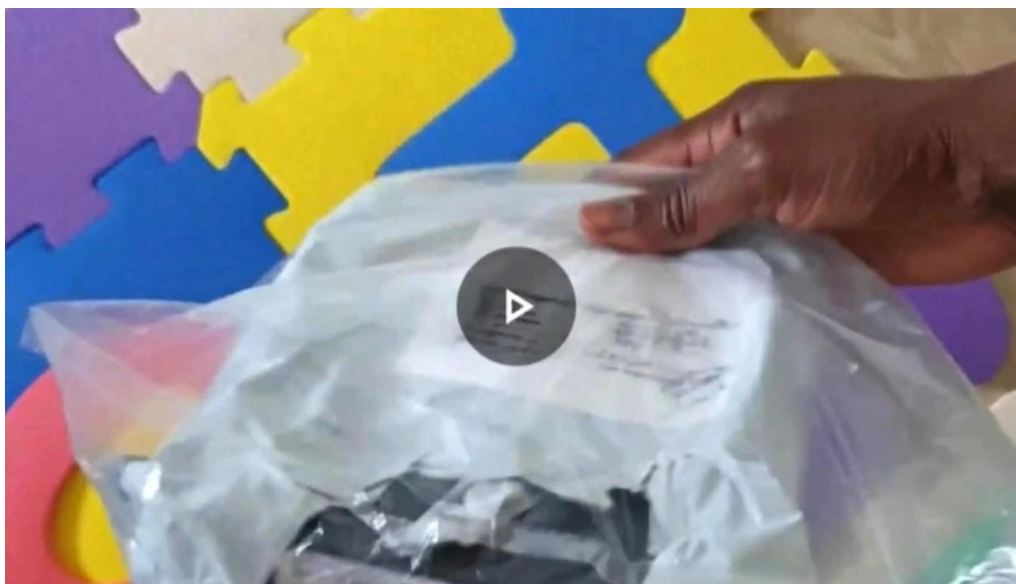
Loja ctt alqueirao mem martins