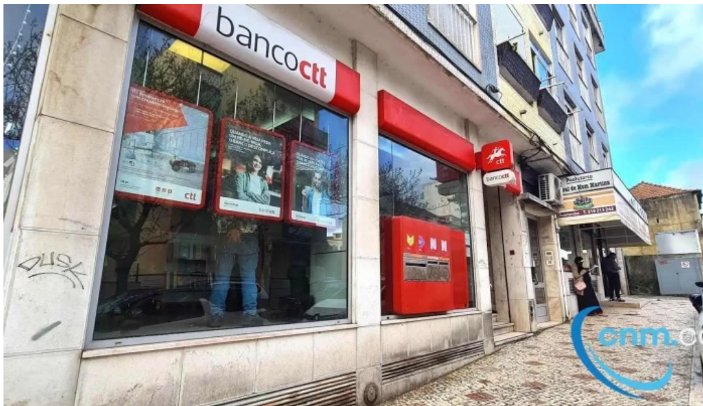
Loja ctt exterior