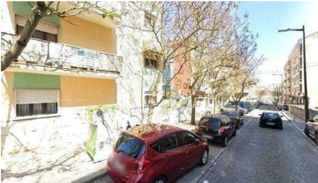
Loja ctt street view e 360deg