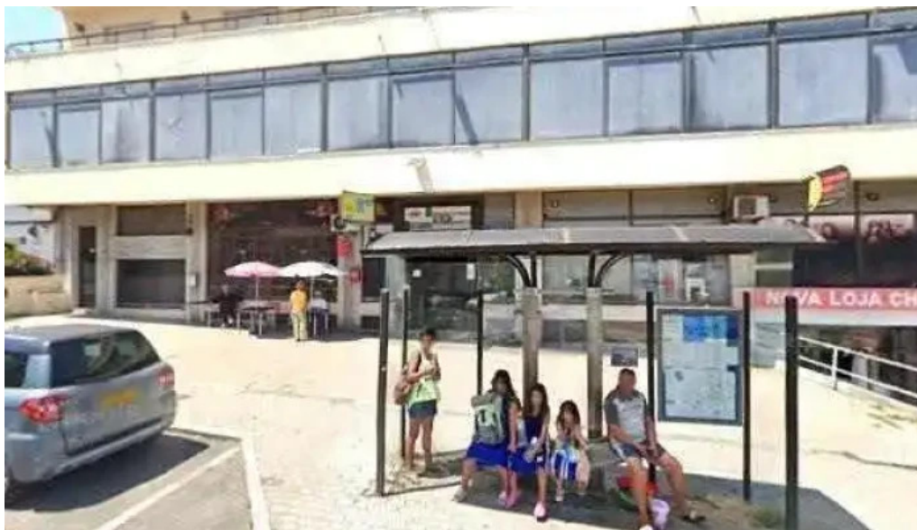
Ponto ctt tudo