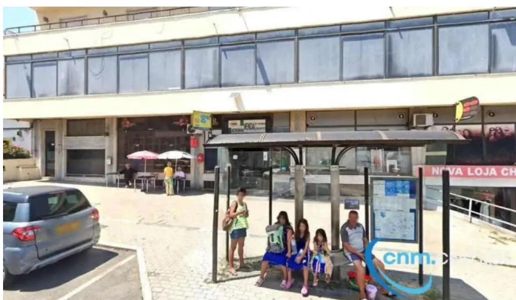
Ponto ctt amadora