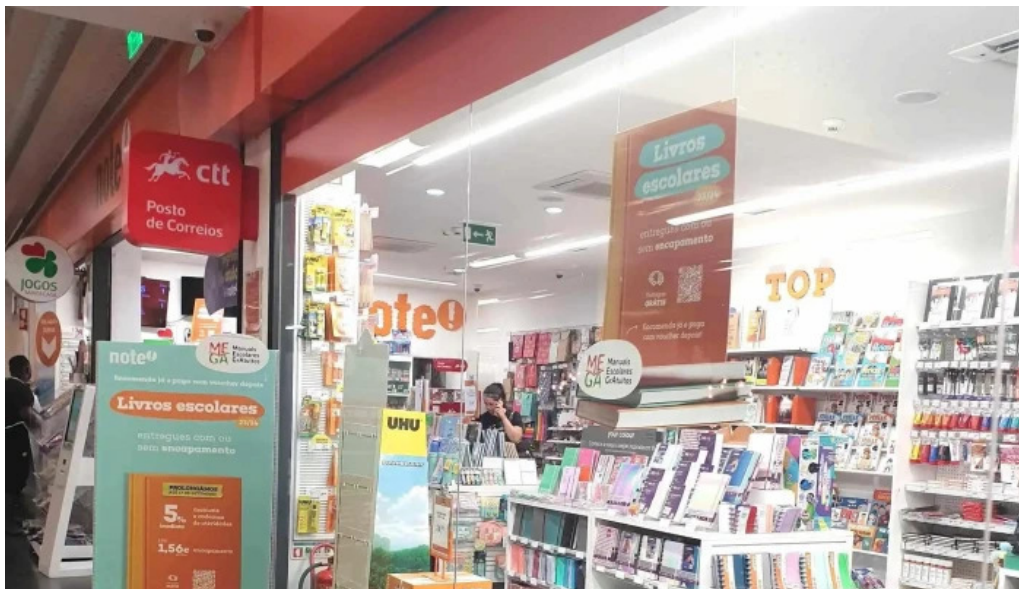
Ponto ctt correios