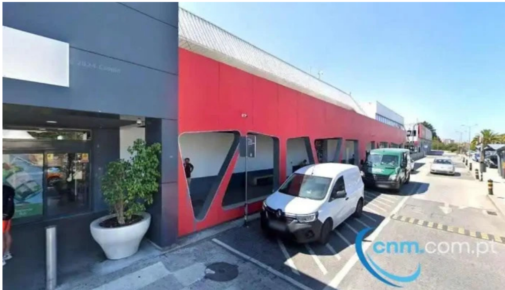
Ponto ctt amadora