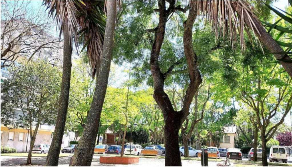
Posto de correios da venda nova tudo