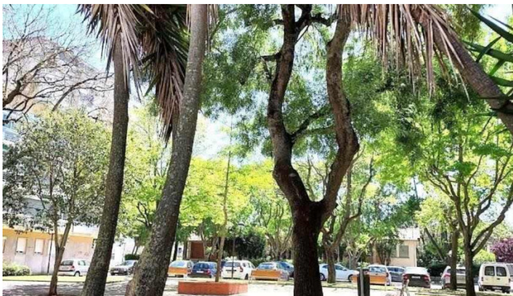
Posto de correios da venda nova amadora