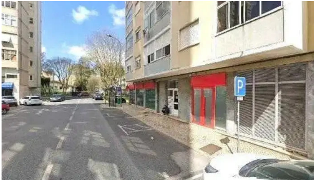
Posto de correios da venda nova street view e 360deg