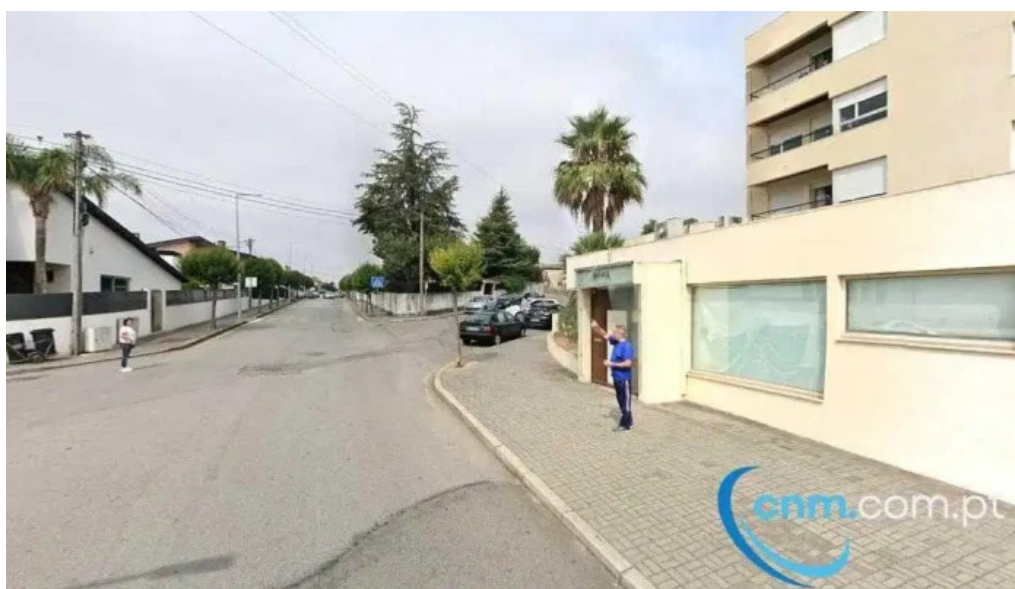
Estacao dos correios de santa maria de lamas av comendador henrique amorim