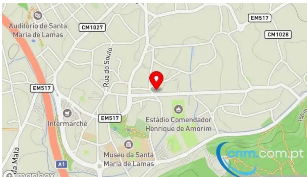
Estacao dos correios de santa maria de lamas mapa