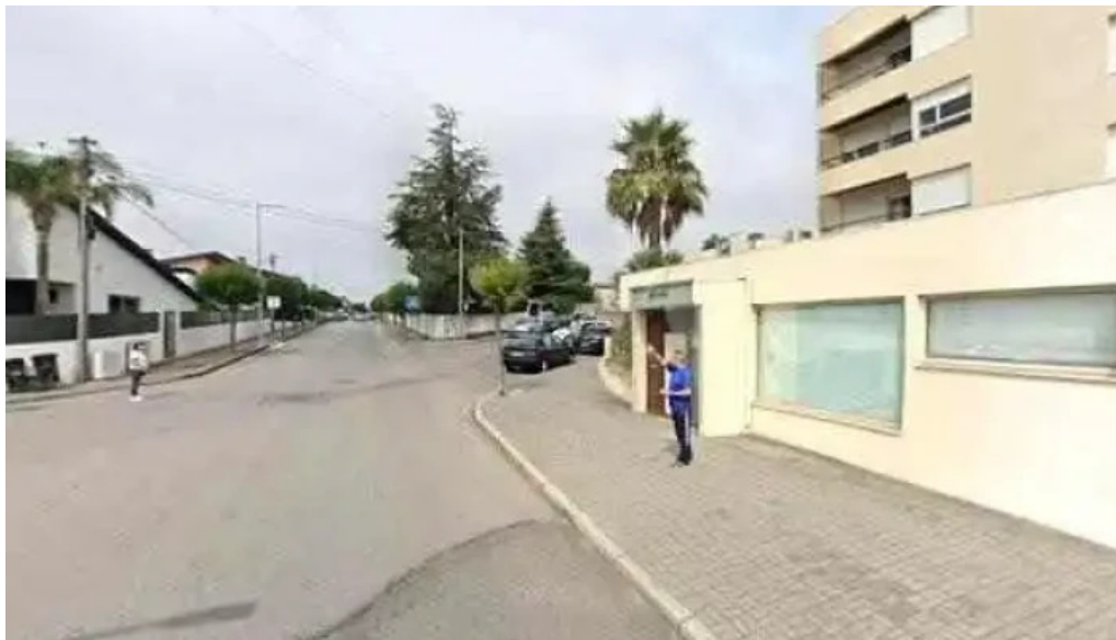
Estacao dos correios de santa maria de lamas tudo