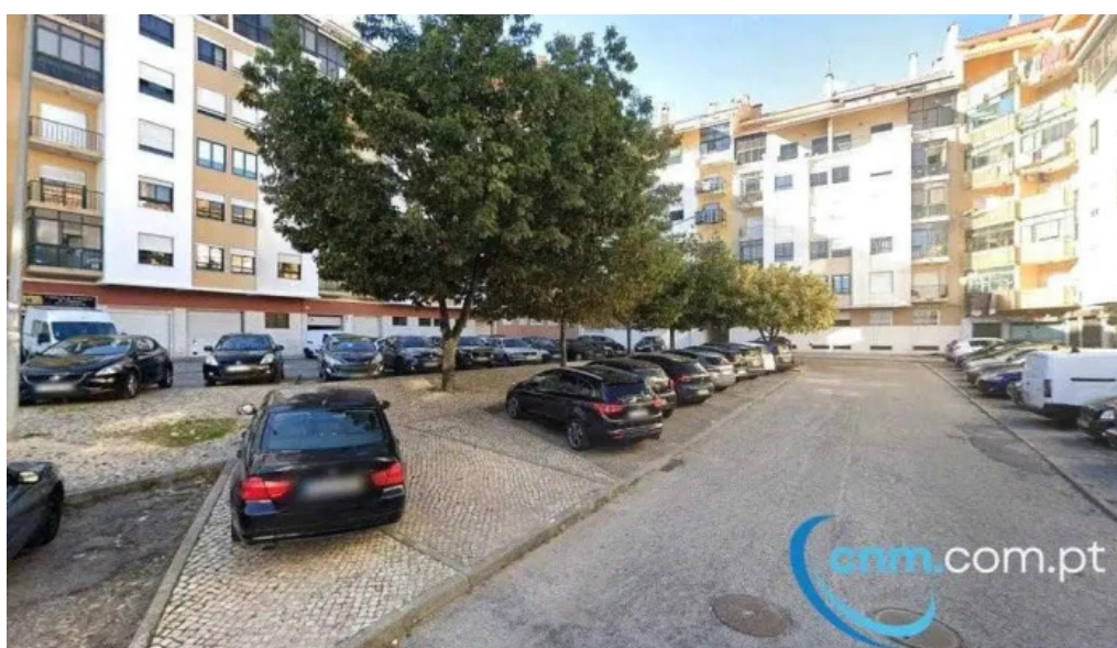
Ponto ctt belas