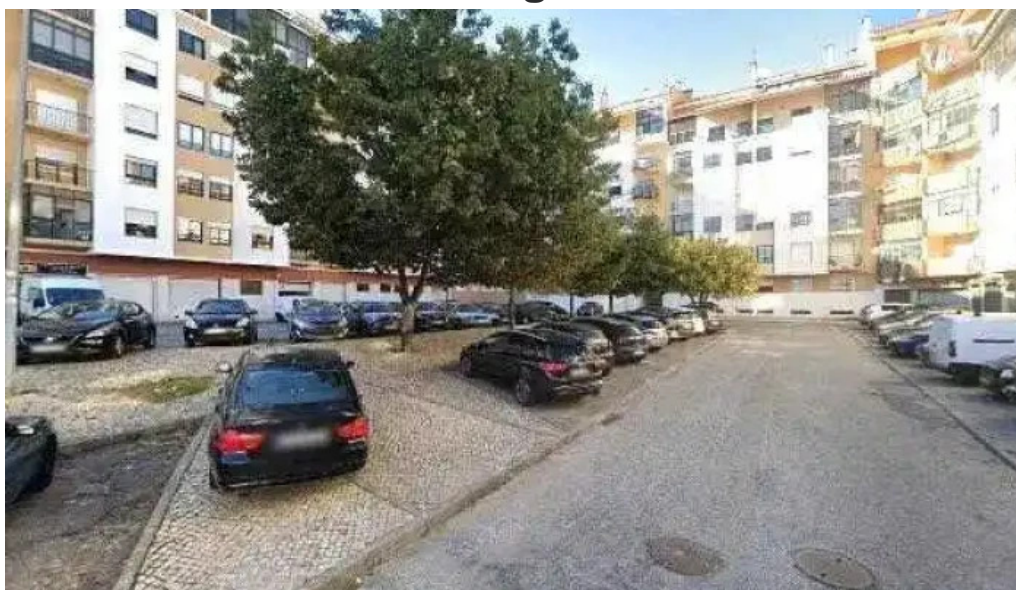
Ponto ctt tudo