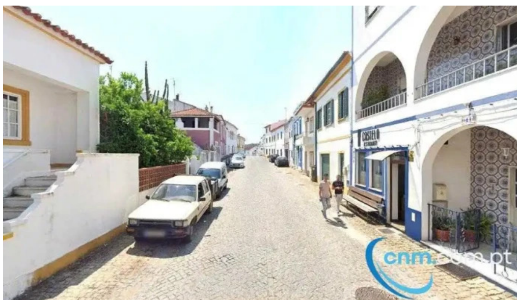
Ponto ctt belver