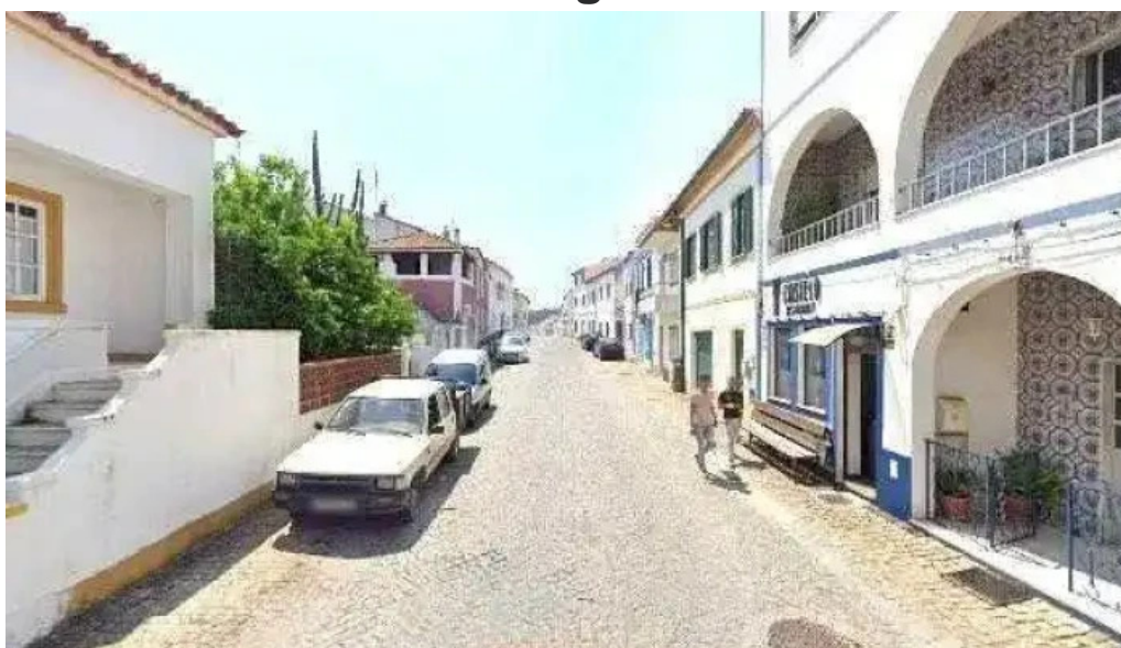
Ponto ctt tudo