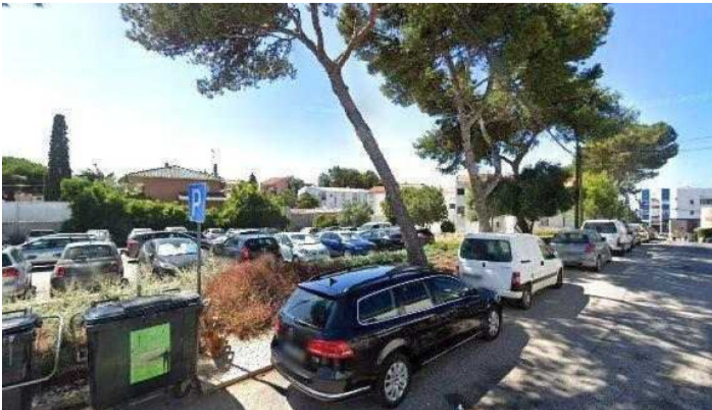
Ctt street view e 360deg