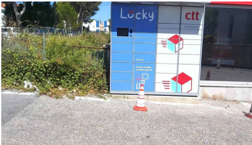
Ctt do proprietario