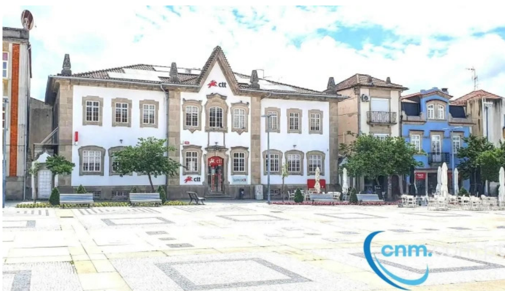
Loja ctt chaves