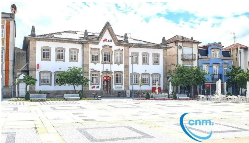
Loja ctt tudo