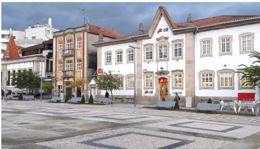
Loja ctt correios