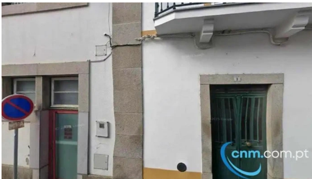
Loja ctt crato