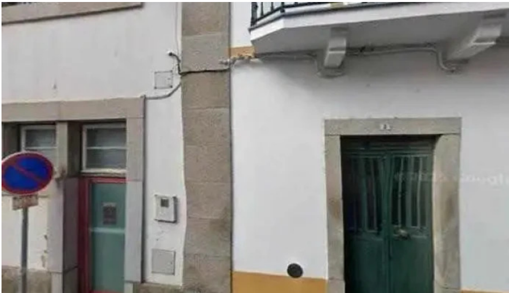
Loja ctt tudo