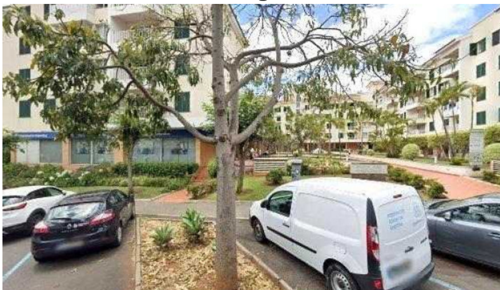
Ponto ctt tudo