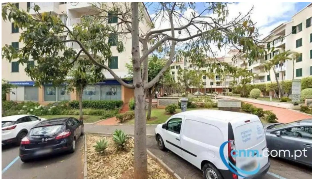
Ponto ctt funchal