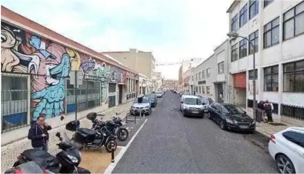
Loja ctt street view e 360deg