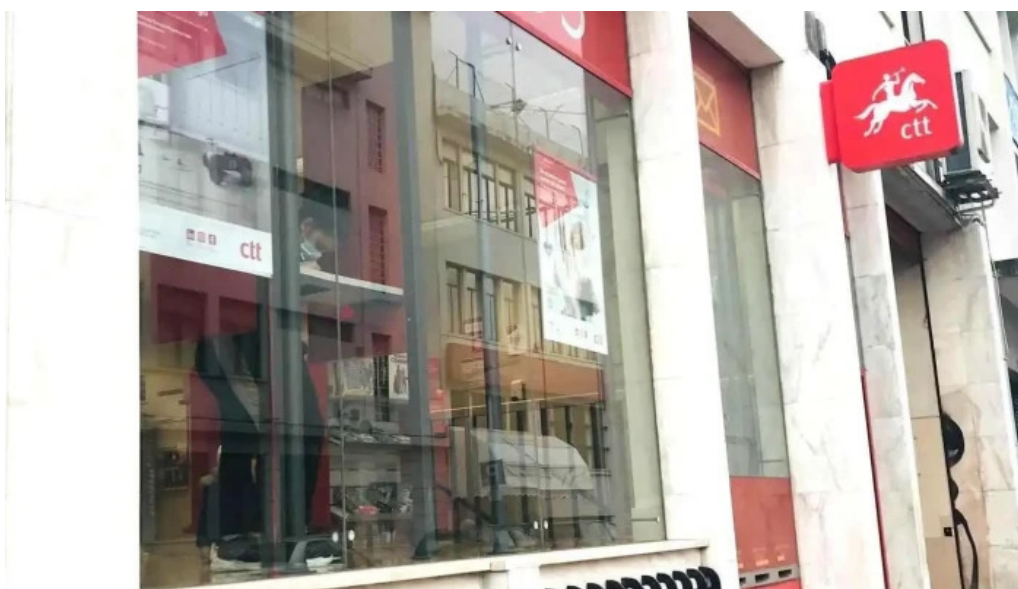
Loja ctt exterior