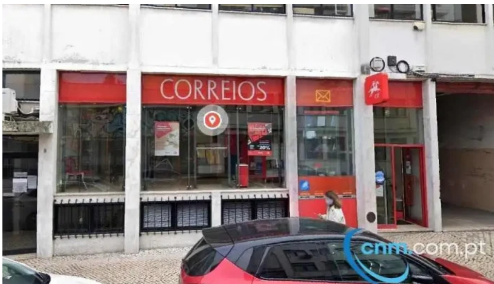
Loja ctt lisboa