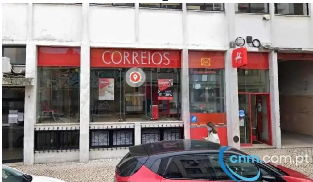
Loja ctt tudo