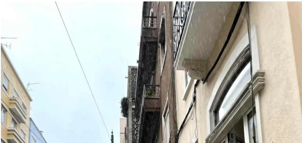
Loja ctt lisboa