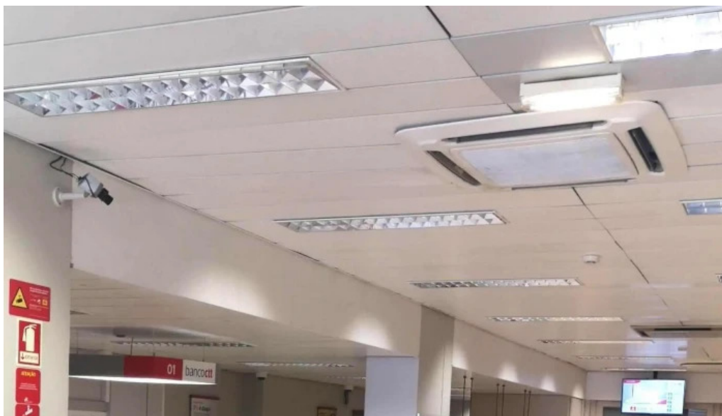
Loja ctt fotos