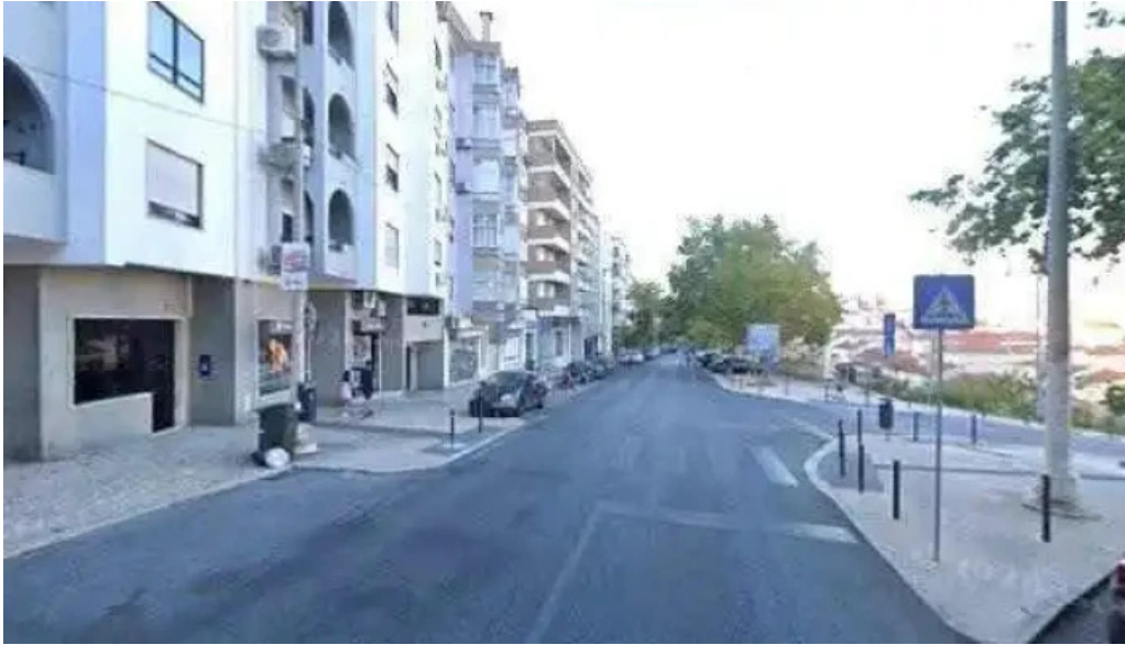
Loja ctt street view e 360deg