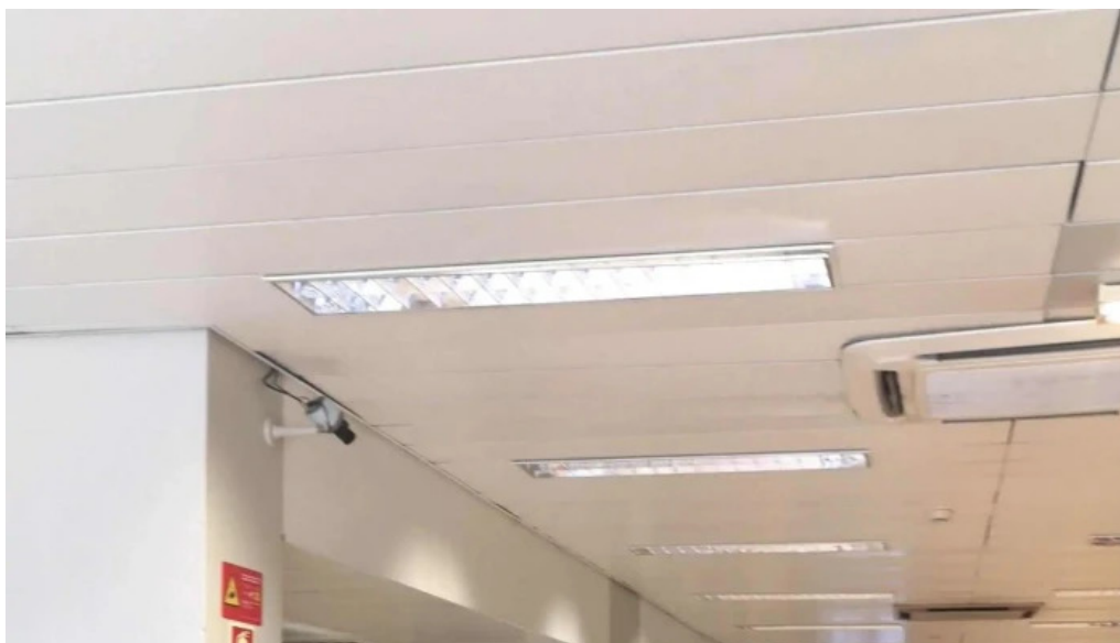
Loja ctt comentarios