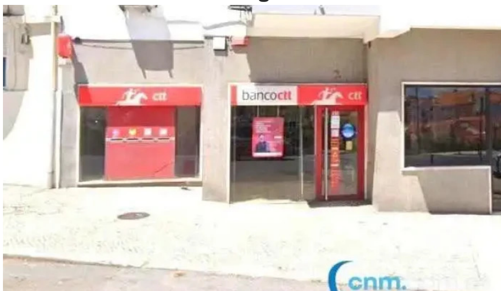
Loja ctt tudo