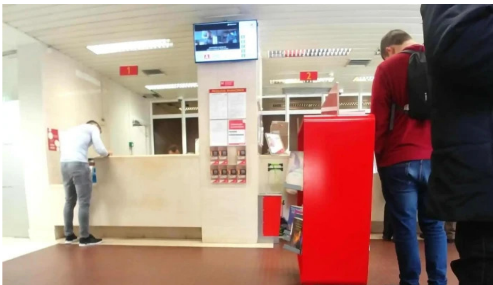
Loja ctt correios