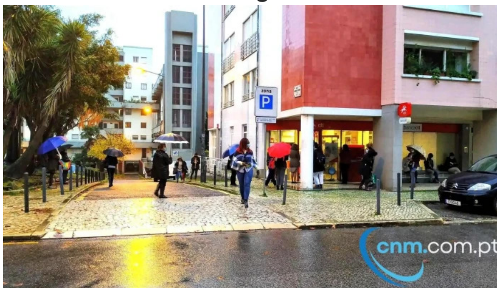
Loja ctt tudo