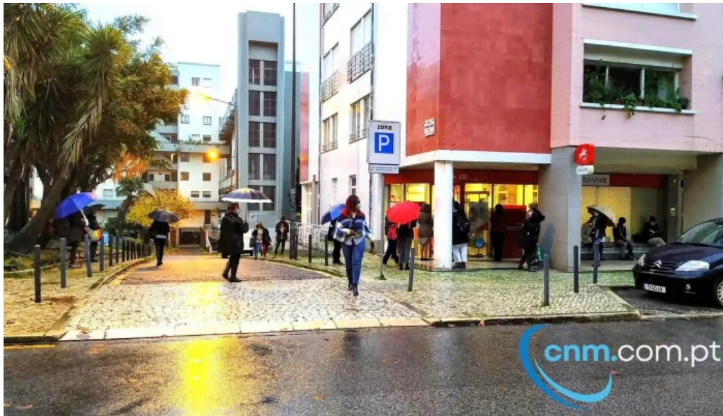
Loja ctt lisboa