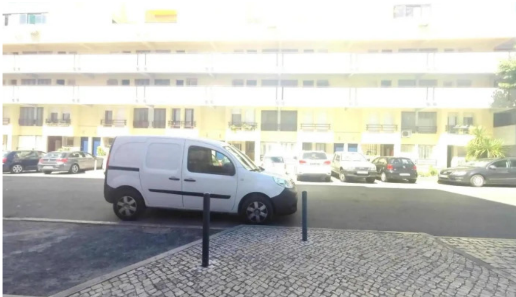
Loja ctt street view e 360deg