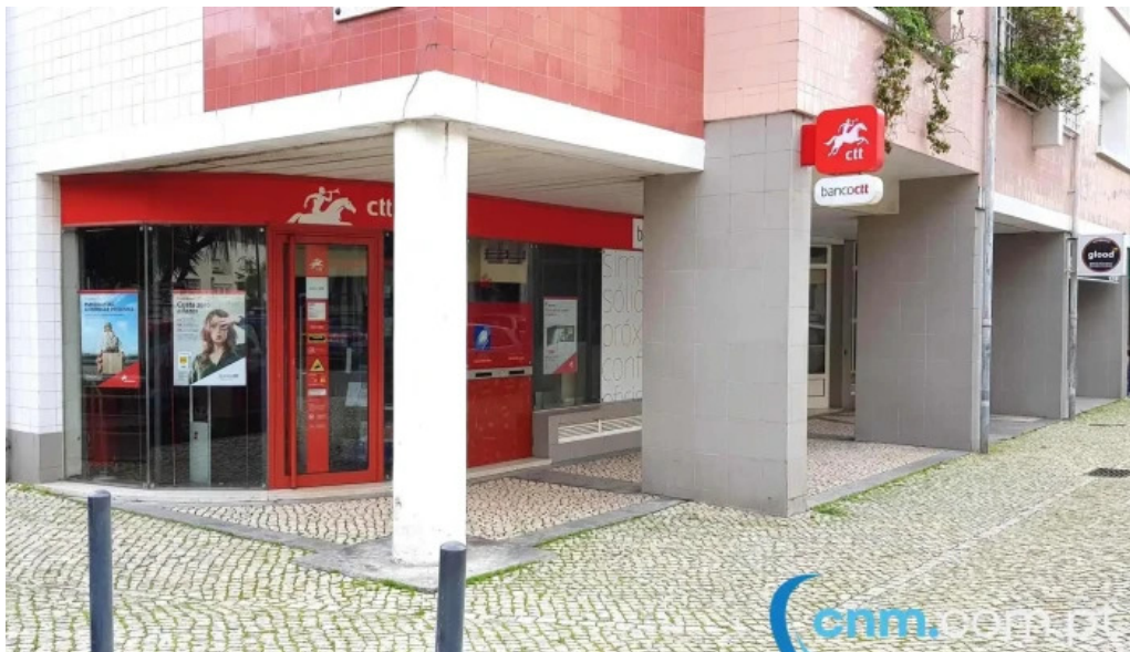
Loja ctt exterior