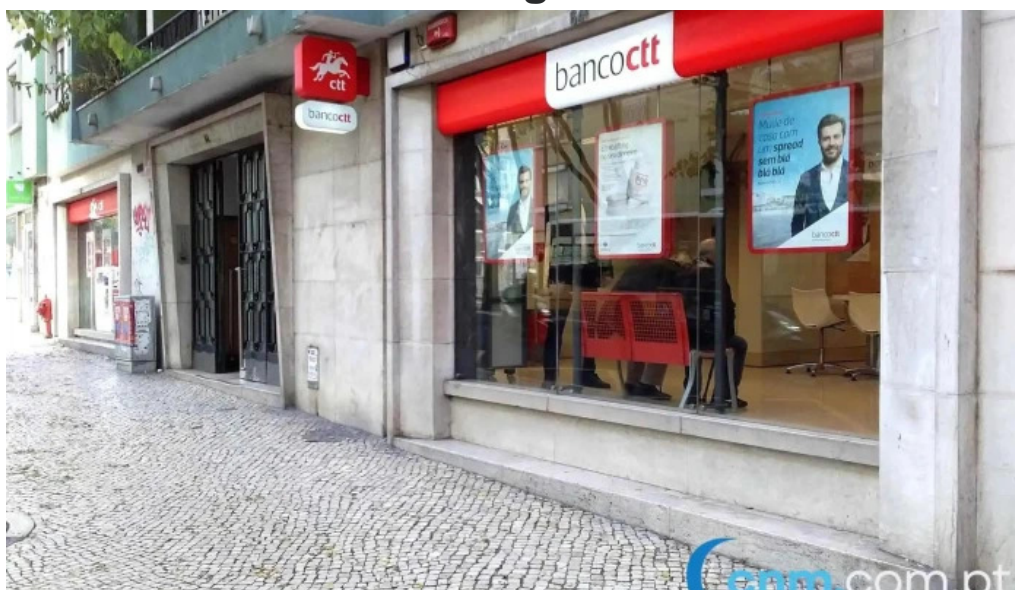
Loja ctt tudo