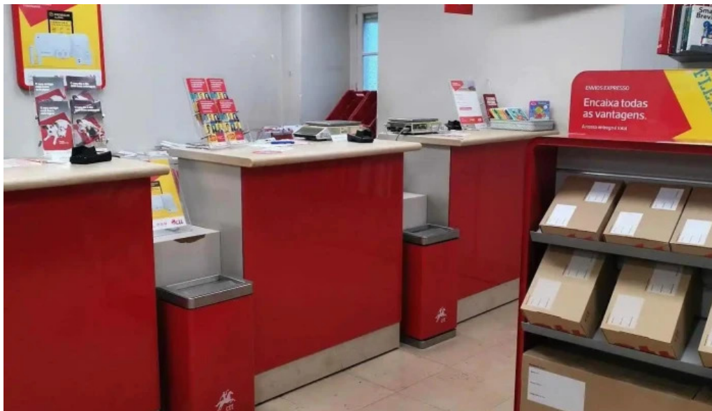
Loja ctt interior