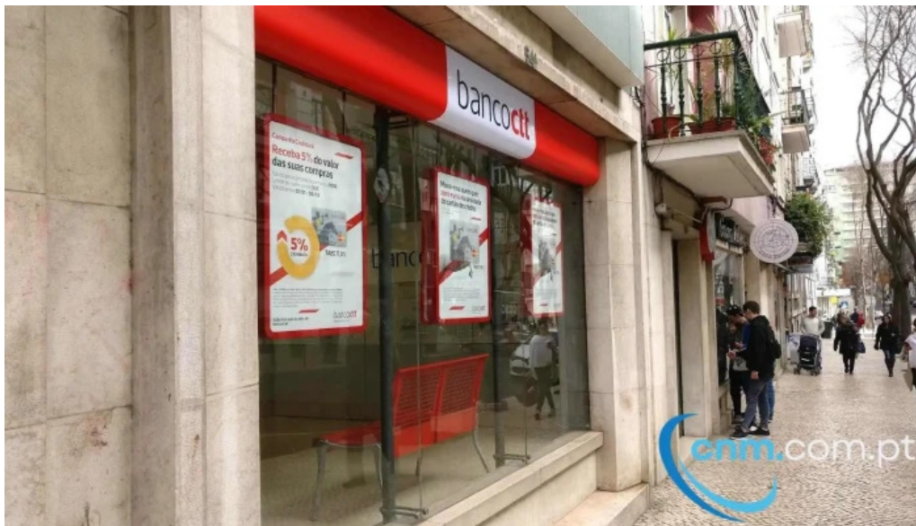
Loja ctt exterior