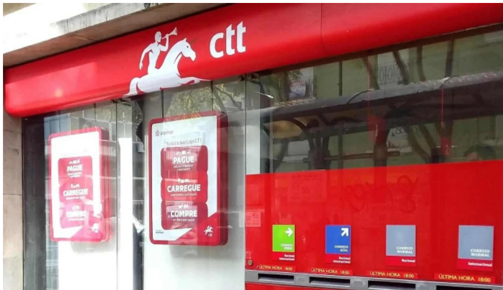
Loja ctt localizacao