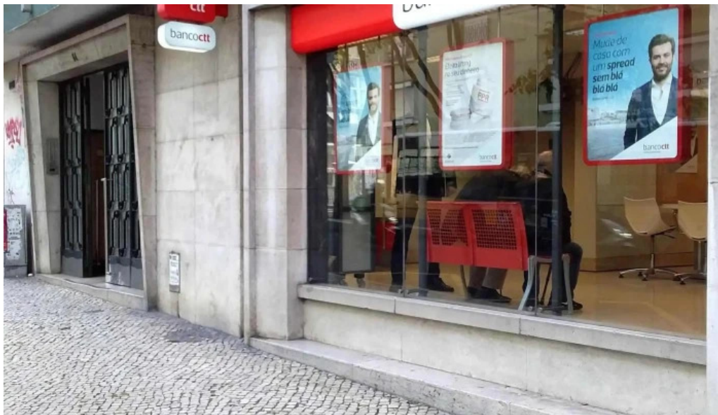
Loja ctt instagram