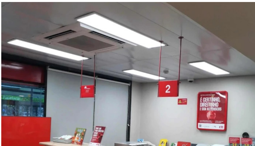
Loja ctt correios