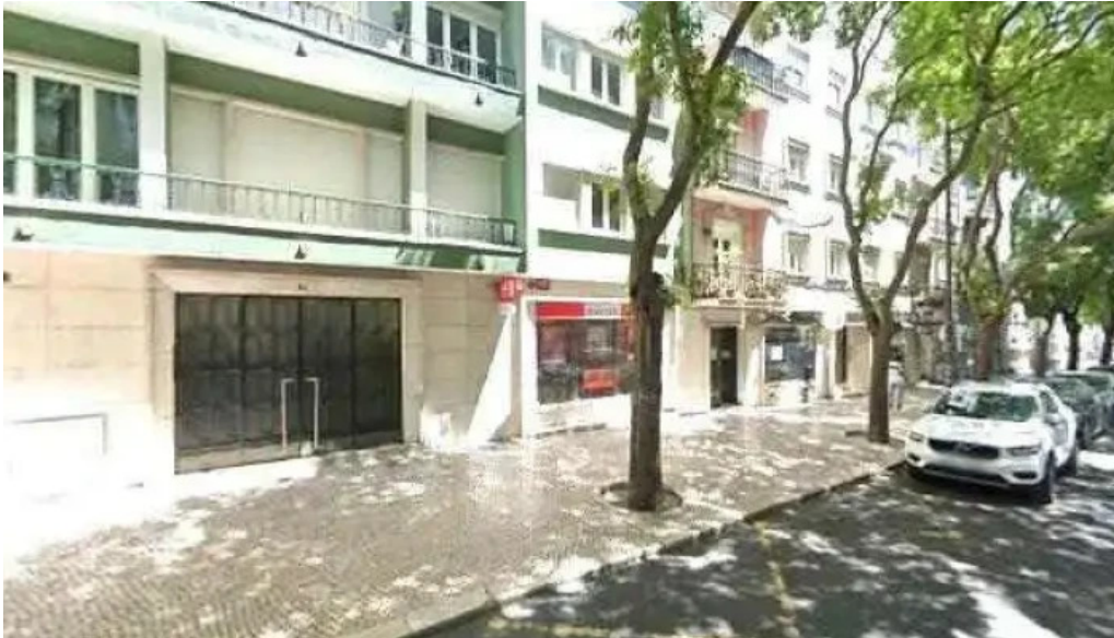
Loja ctt street view e 360deg