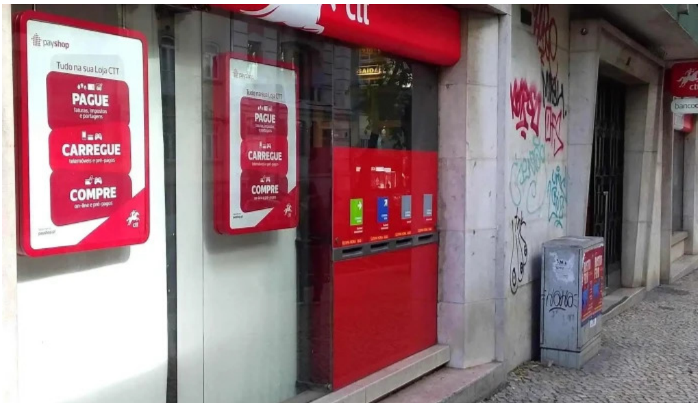
Loja ctt opinioes