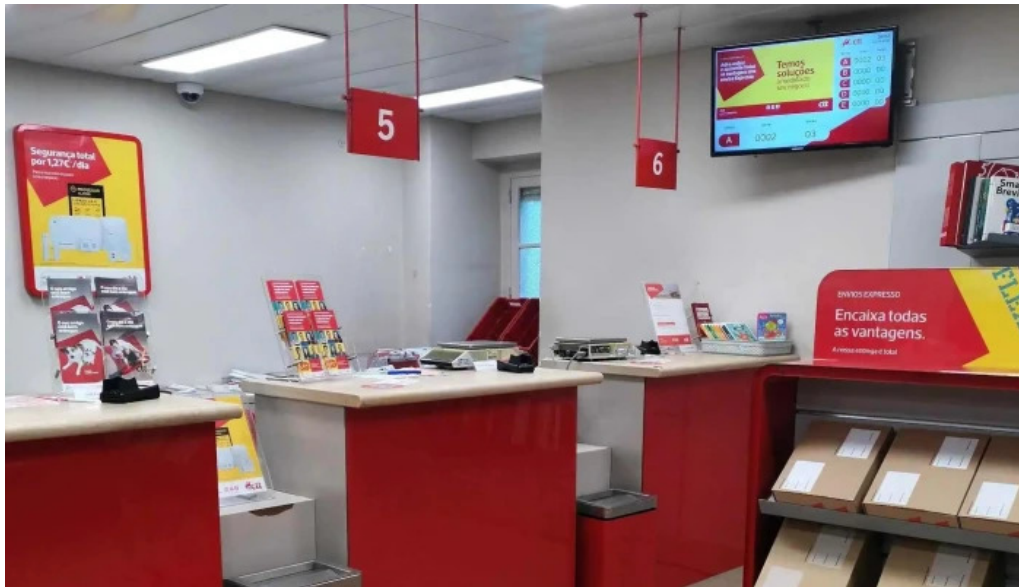
Loja ctt lisboa