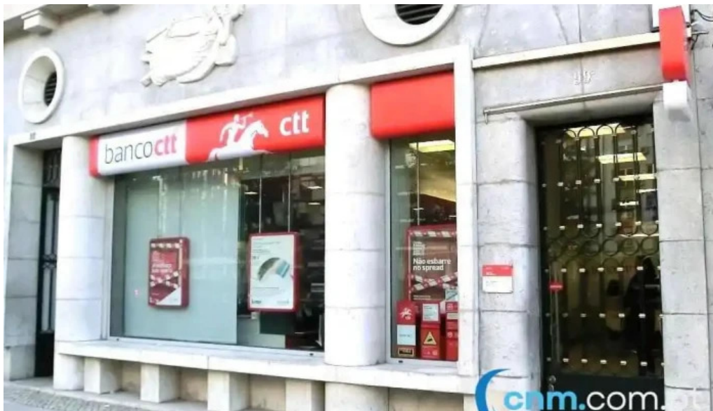
Loja ctt exterior