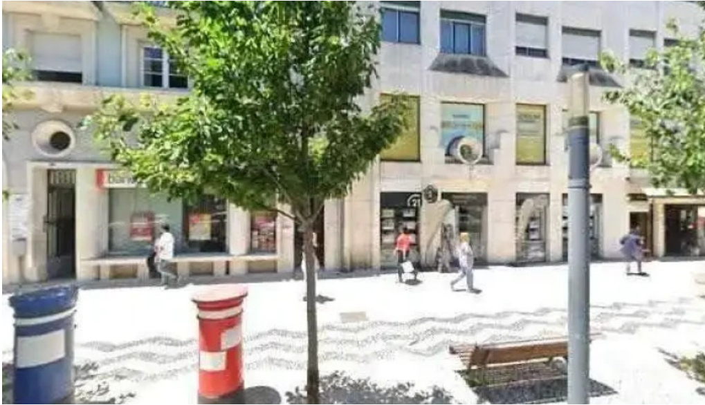
Loja ctt street view e 360deg