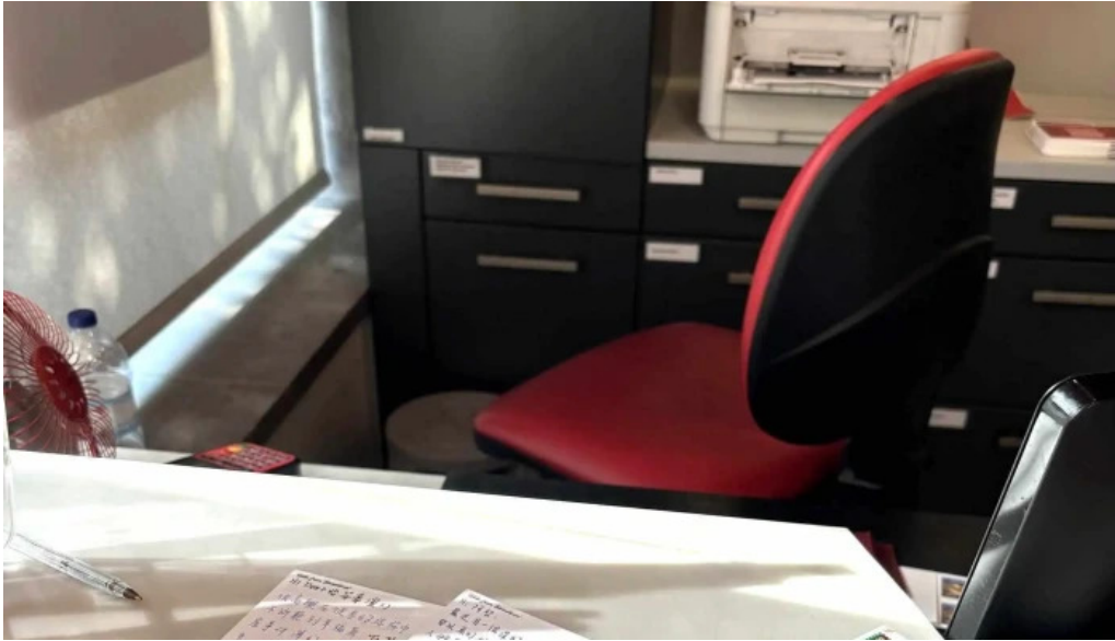
Loja ctt lisboa