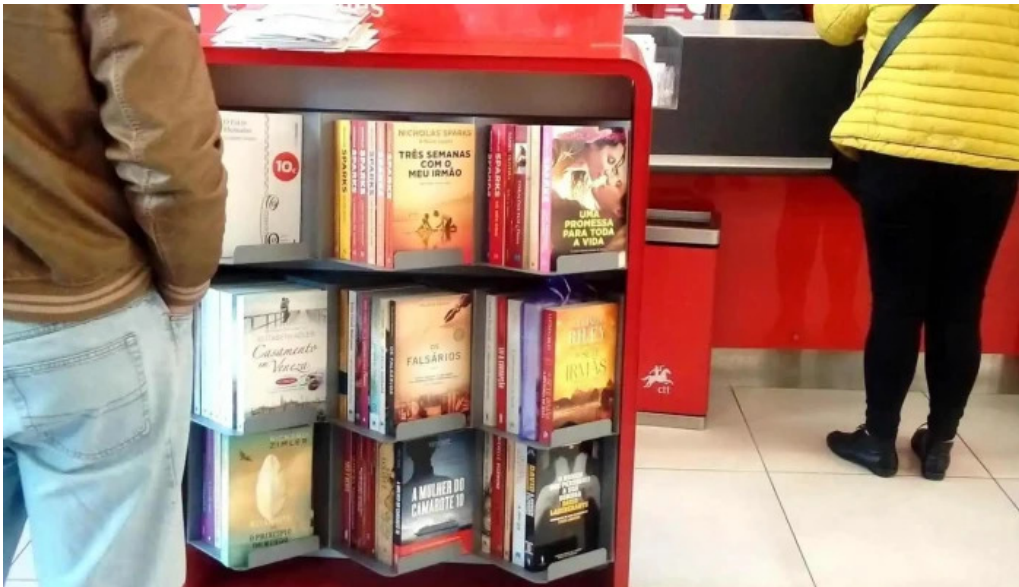
Loja ctt interior