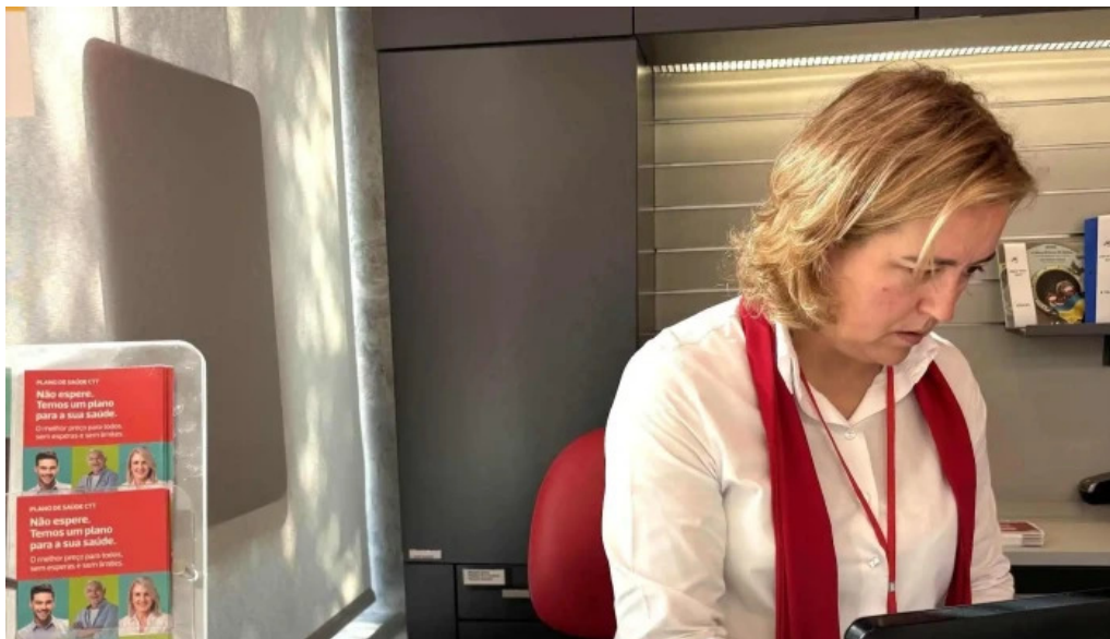
Loja ctt correios