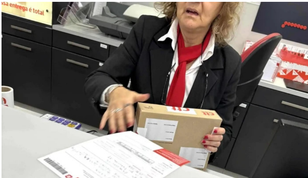
Loja ctt lisboa