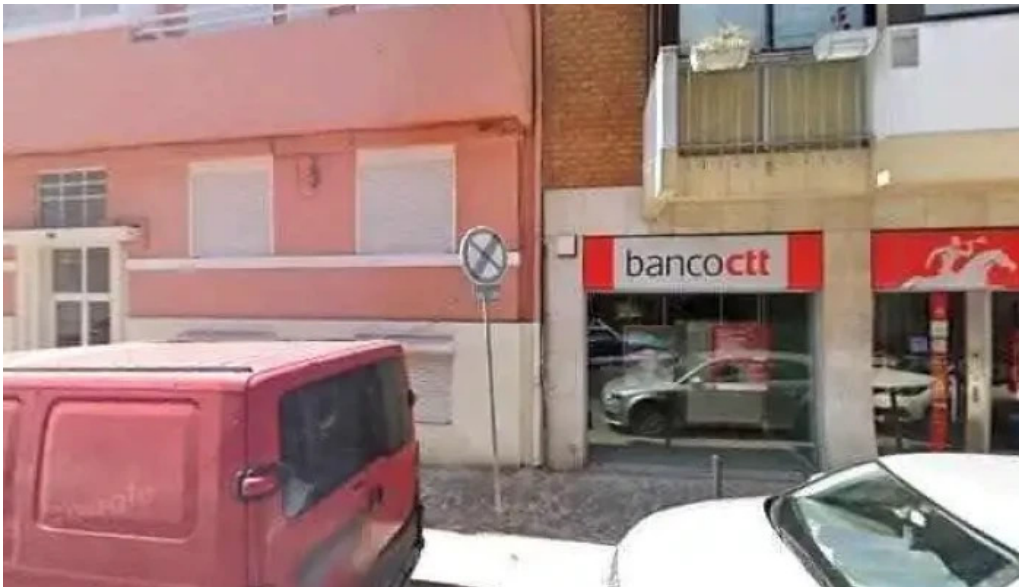
Loja ctt street view e 360deg