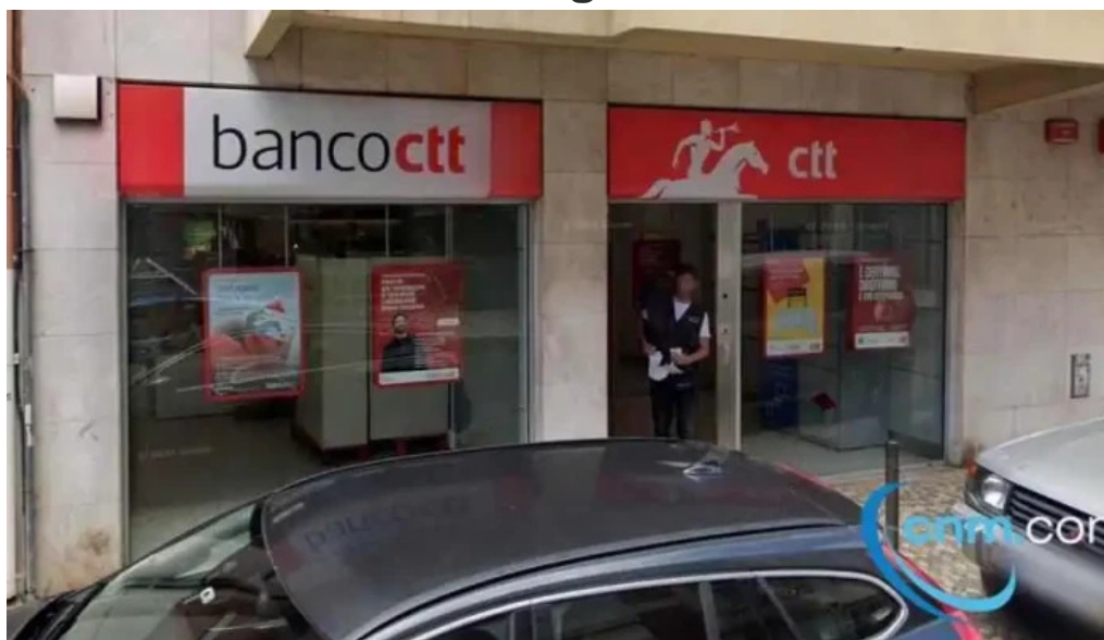
Loja ctt tudo