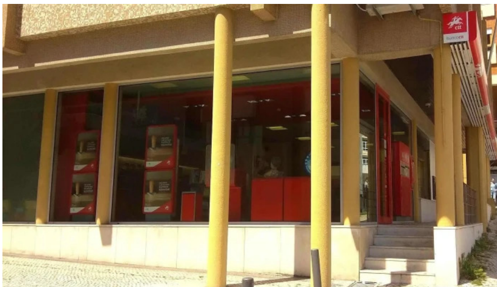
Loja ctt correios