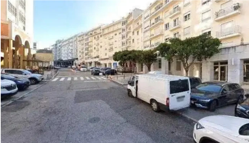
Loja ctt street view e 360deg