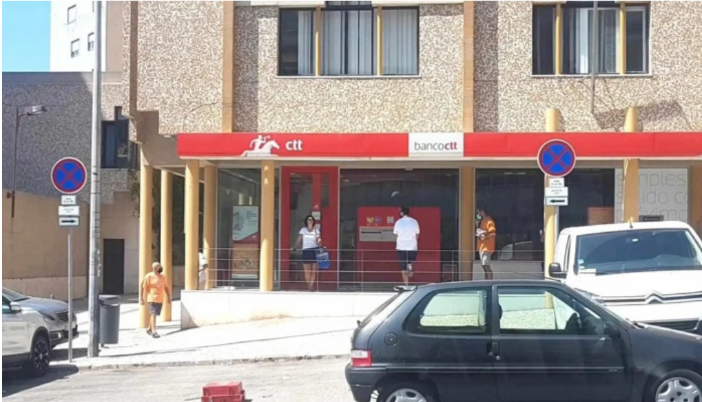
Loja ctt lisboa