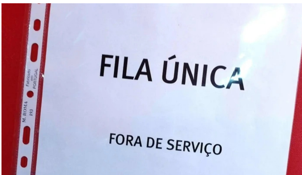
Loja ctt como chegar