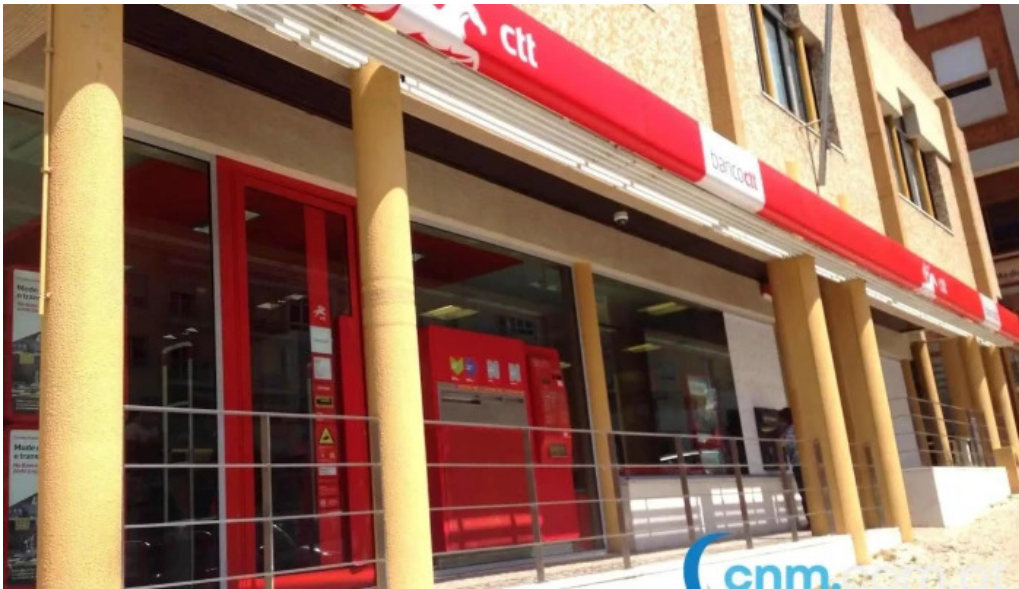
Loja ctt exterior