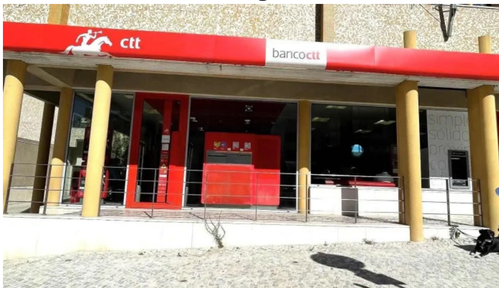
Loja ctt tudo