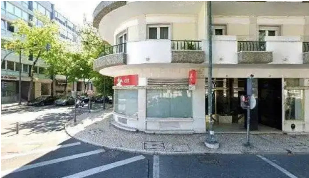
Loja ctt street view e 360deg