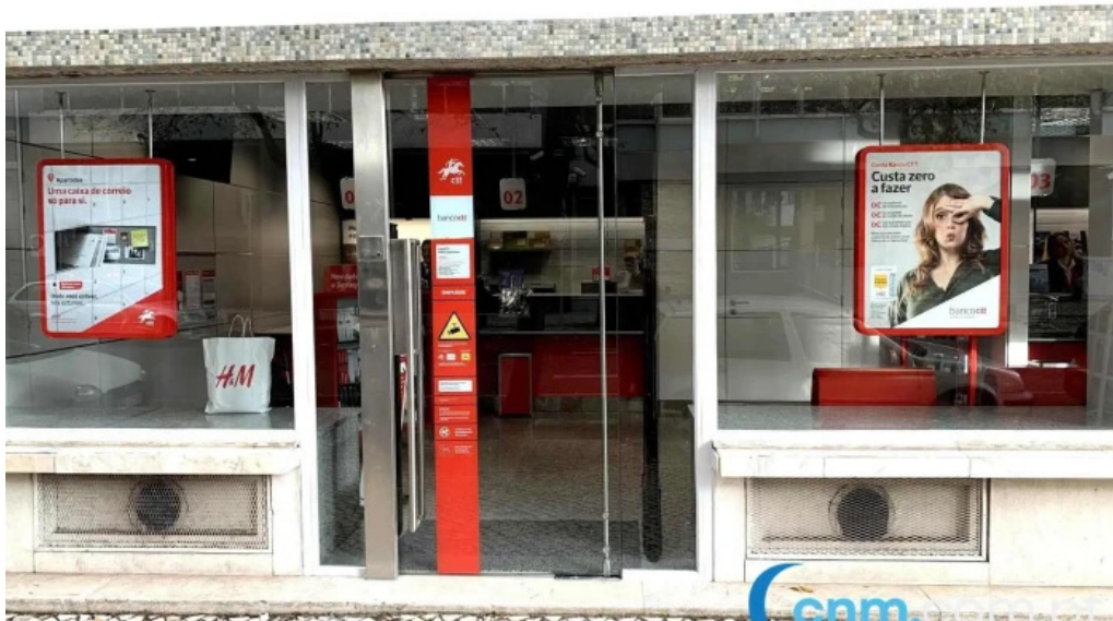
Loja ctt exterior