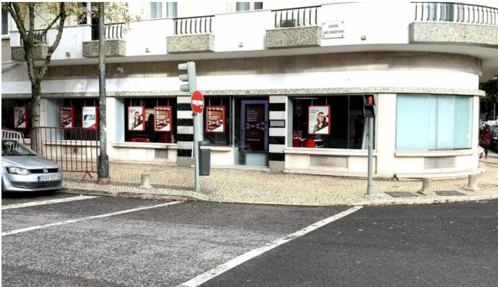
Loja ctt lisboa