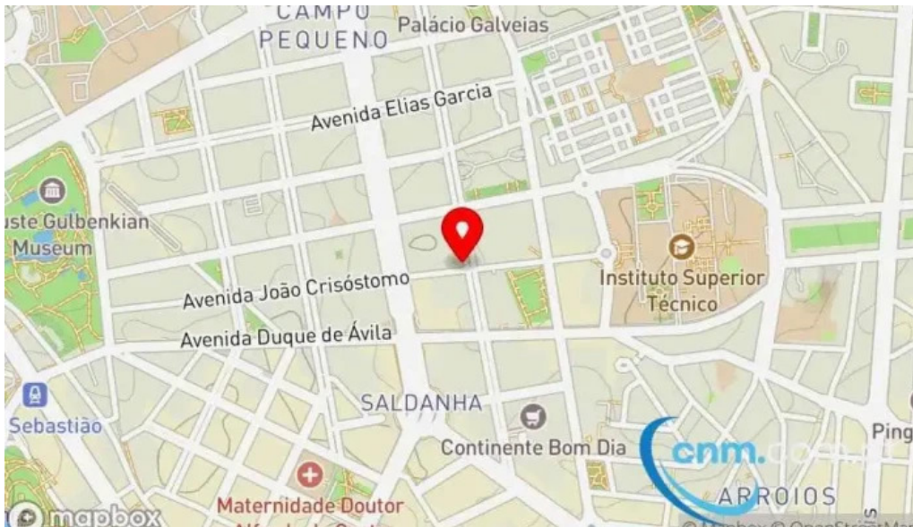
Loja ctt mapa