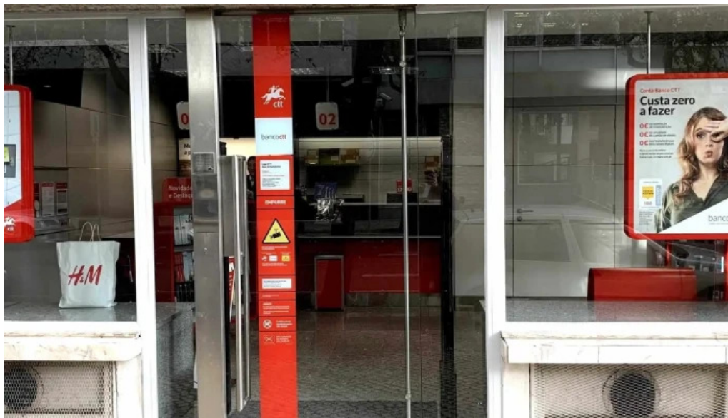
Loja ctt correios