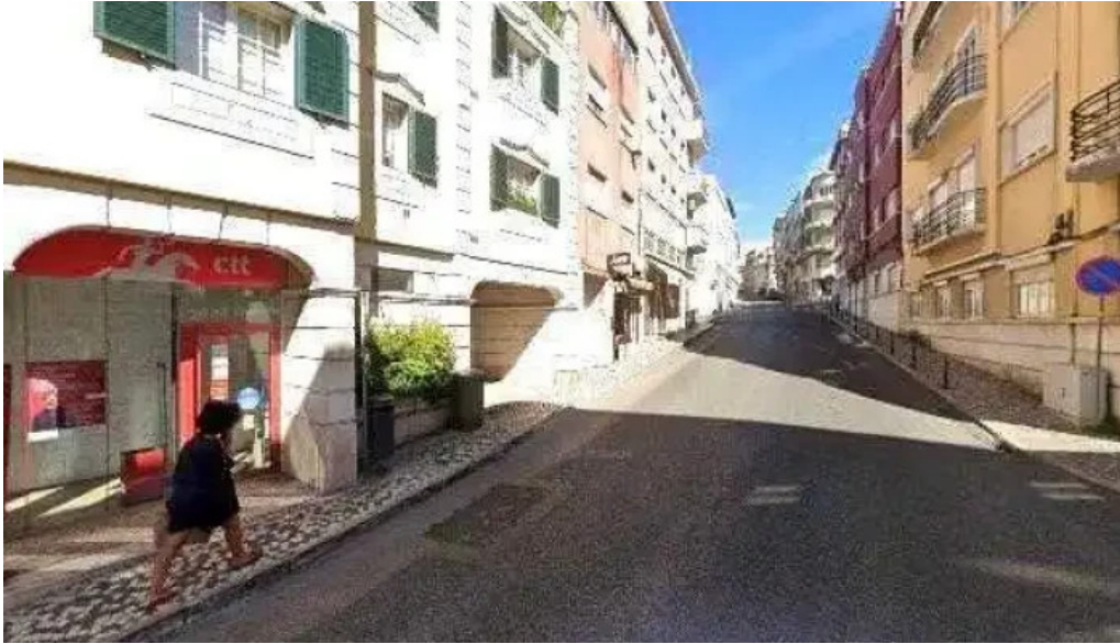
Loja ctt street view e 360deg