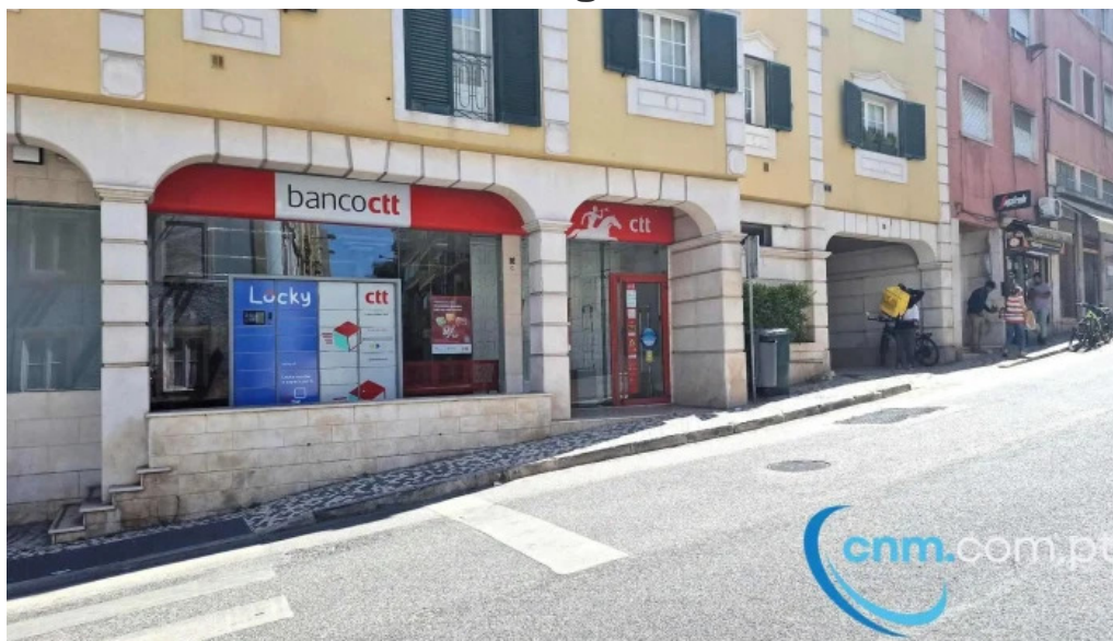
Loja ctt tudo