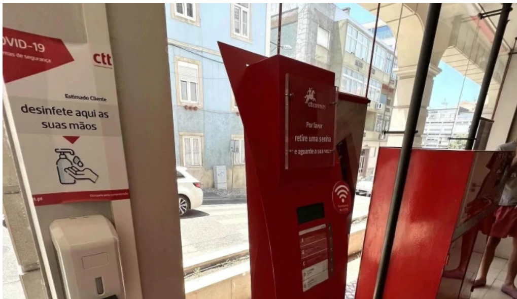
Loja ctt correios