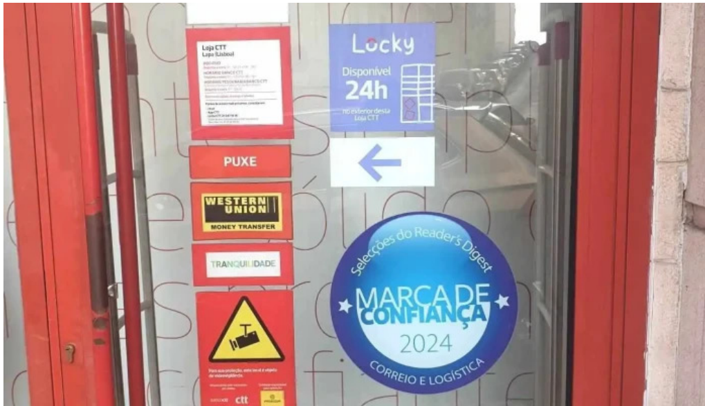
Loja ctt do proprietario