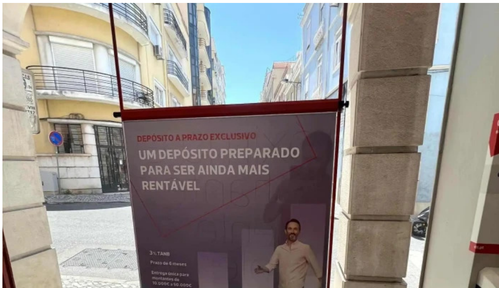
Loja ctt lisboa