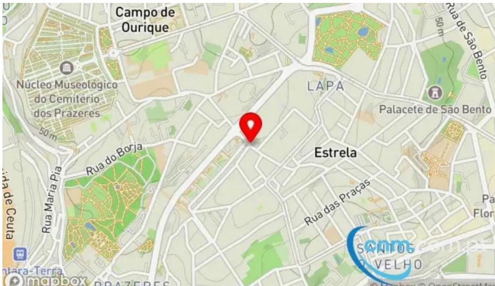
Loja ctt mapa