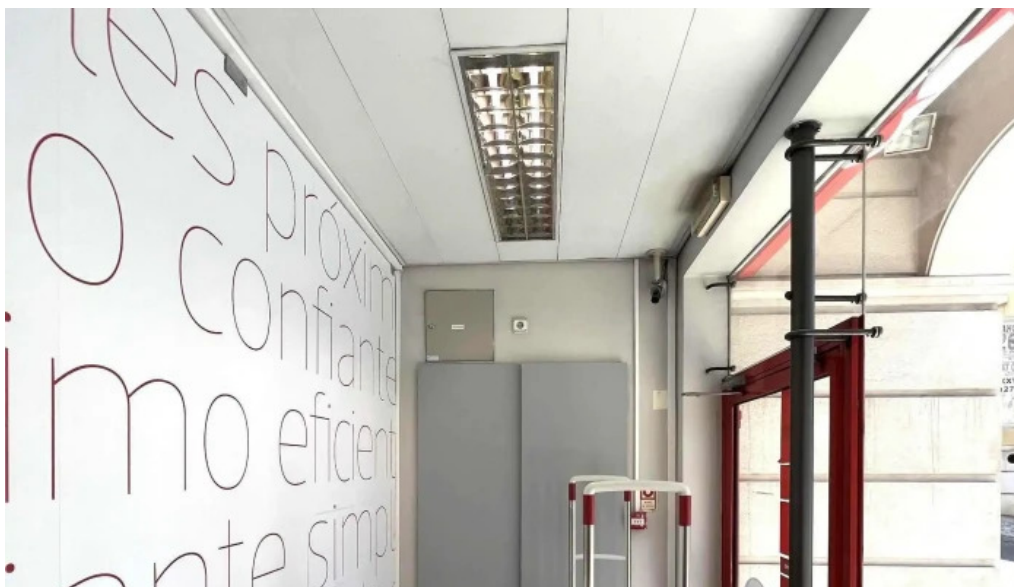
Loja ctt catalogo