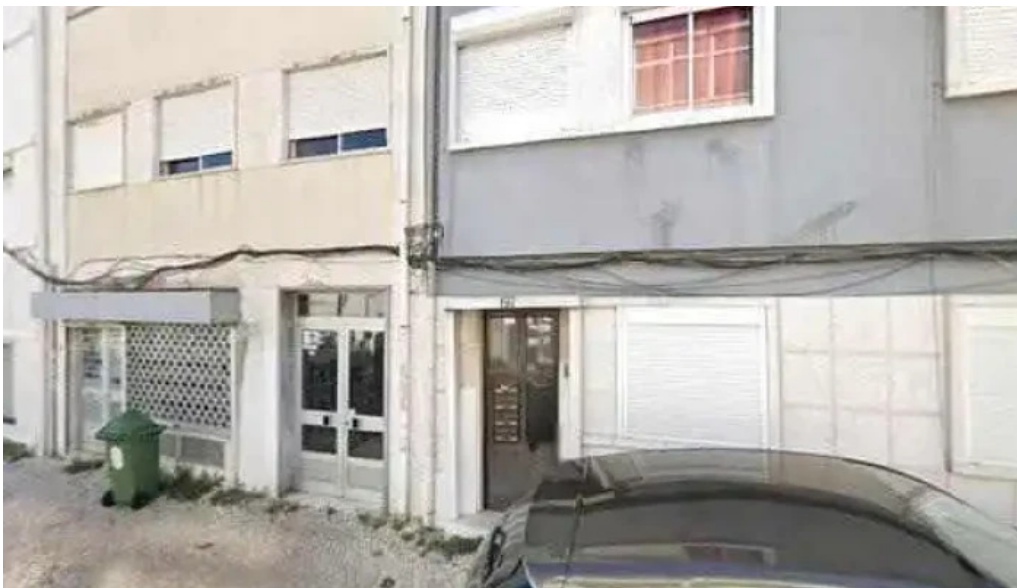
Ponto ctt tudo