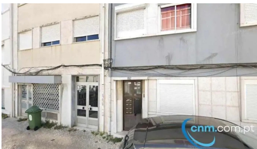
Ponto ctt lisboa