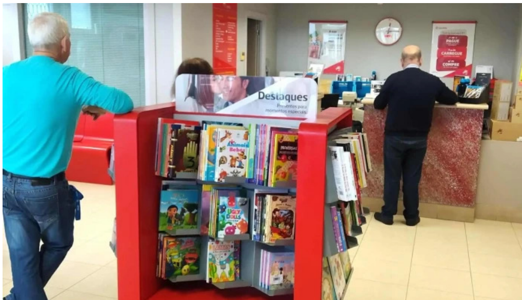
Posto de correios de nossa senhora do rosario correios