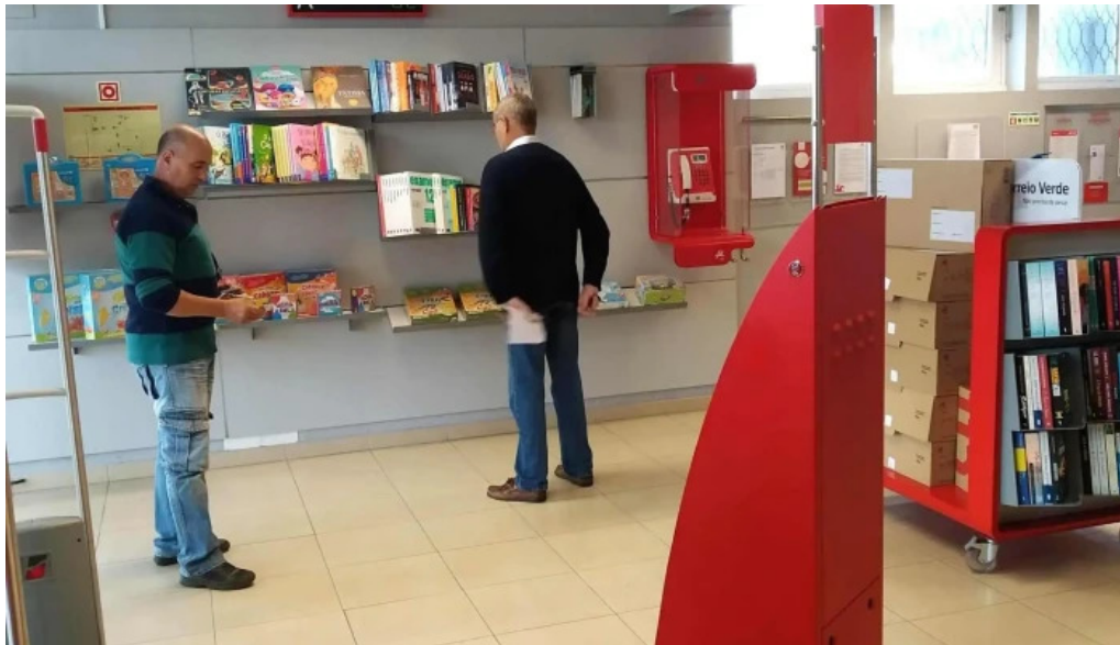
Posto de correios de nossa senhora do rosario nossa senhora do rosario