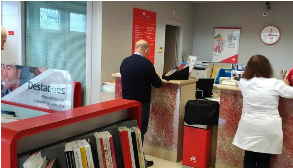
Posto de correios de nossa senhora do rosario opinioes