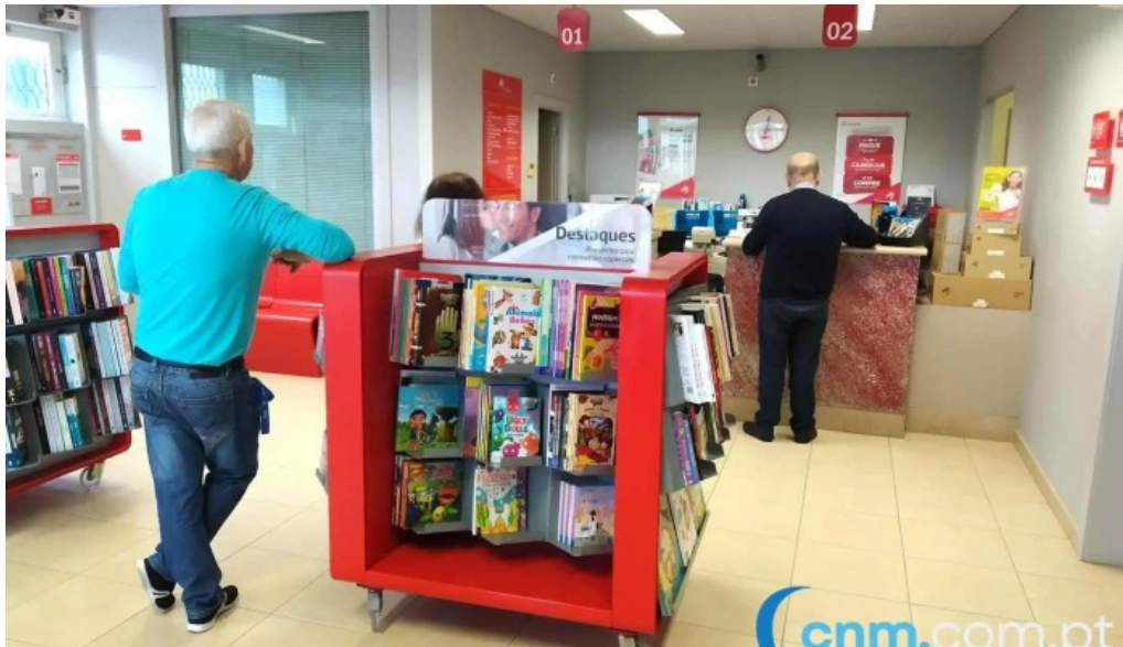
Posto de correios de nossa senhora do rosario interior