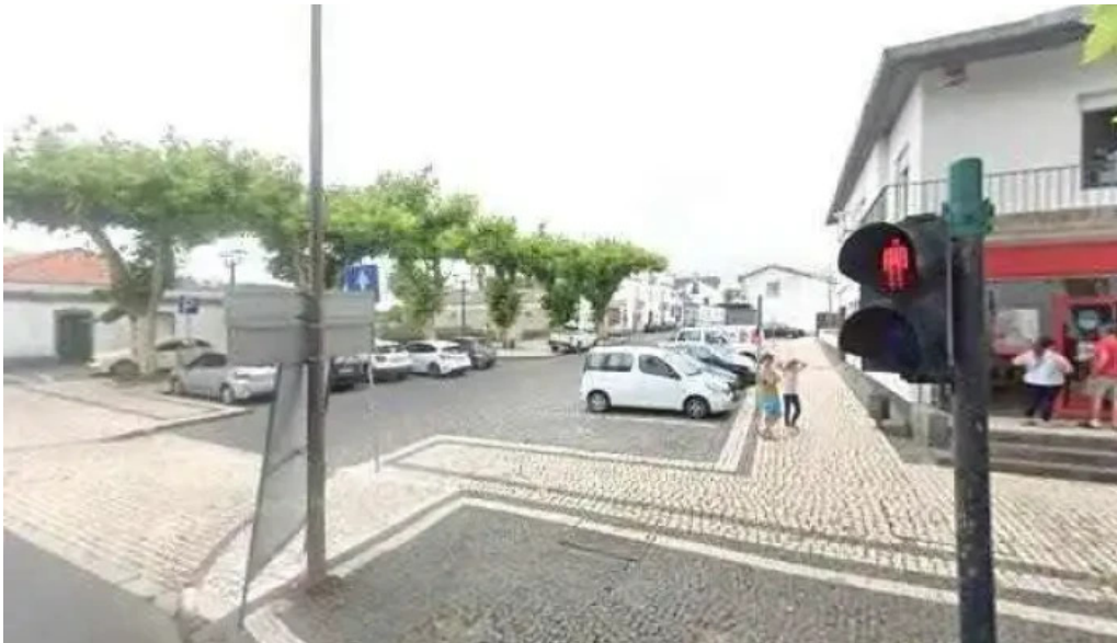
Posto de correios de nossa senhora do rosario street view e 360deg