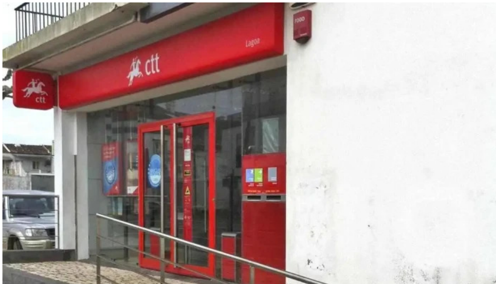
Posto de correios de nossa senhora do rosario tudo