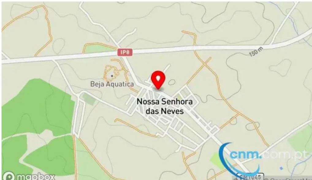
Ponto ctt mapa