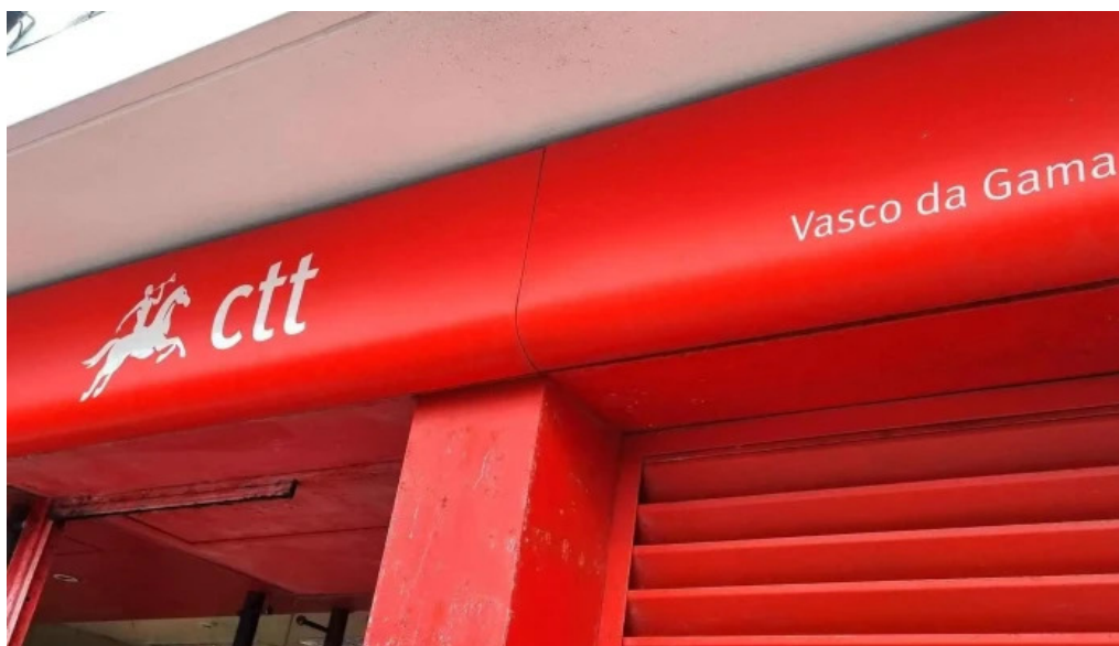
Posto de correios de ponta delgada aberto agora