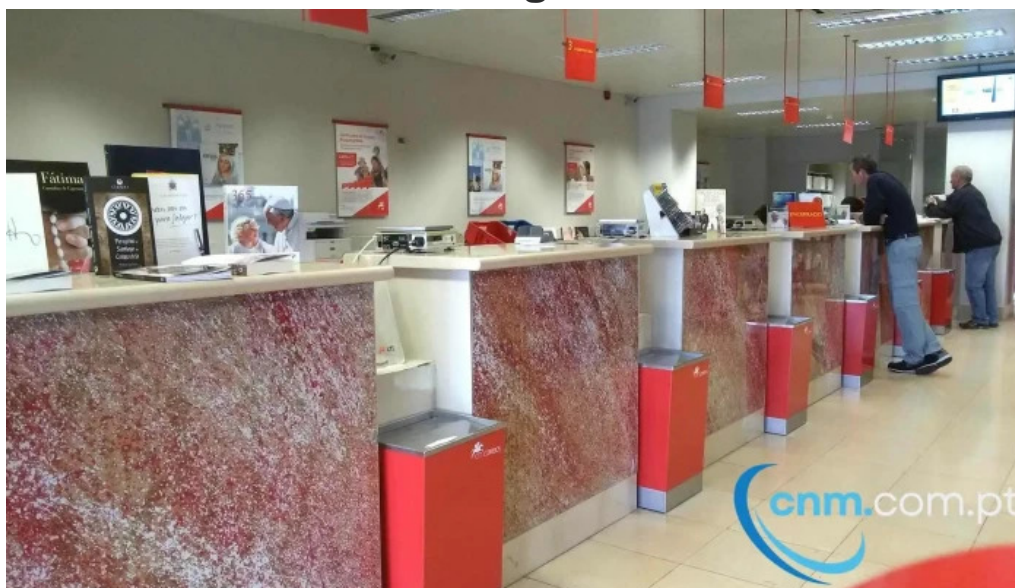
Posto de correios de ponta delgada tudo