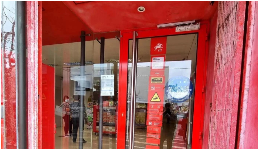
Posto de correios de ponta delgada ponta delgada