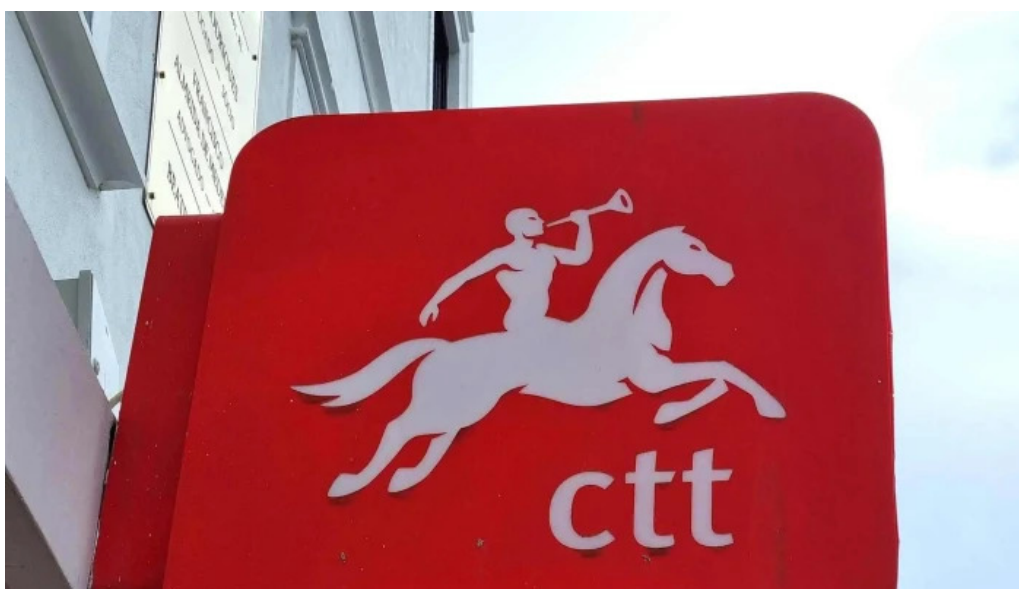
Posto de correios de ponta delgada numero