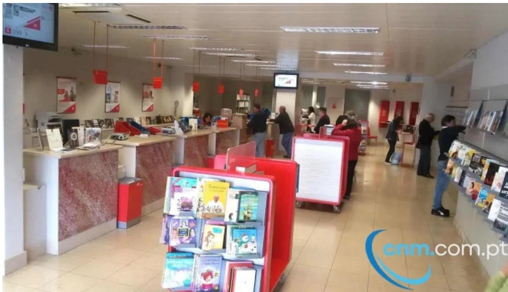
Posto de correios de ponta delgada interior