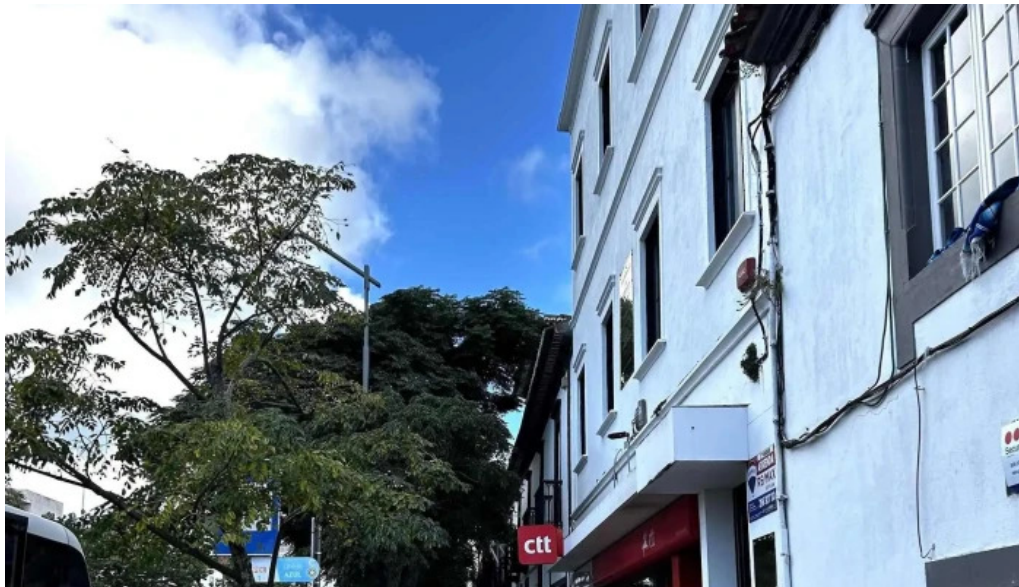
Posto de correios de ponta delgada correios