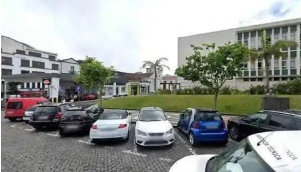
Posto de correios de ponta delgada street view e 360deg