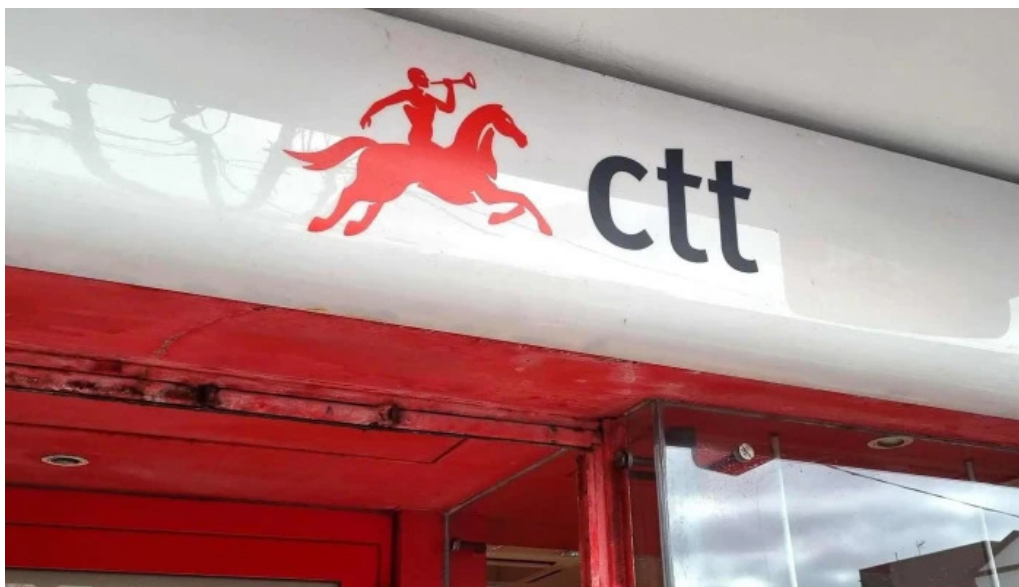
Posto de correios de ponta delgada perto de mim