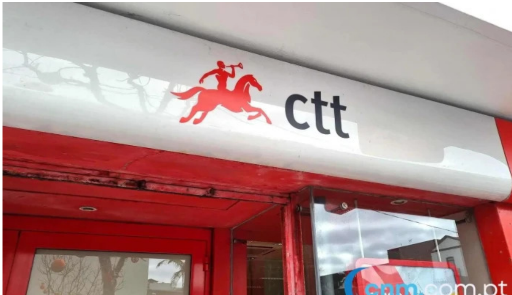
Posto de correios de ponta delgada exterior