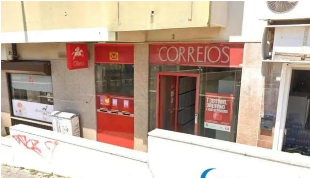
Loja ctt queluz