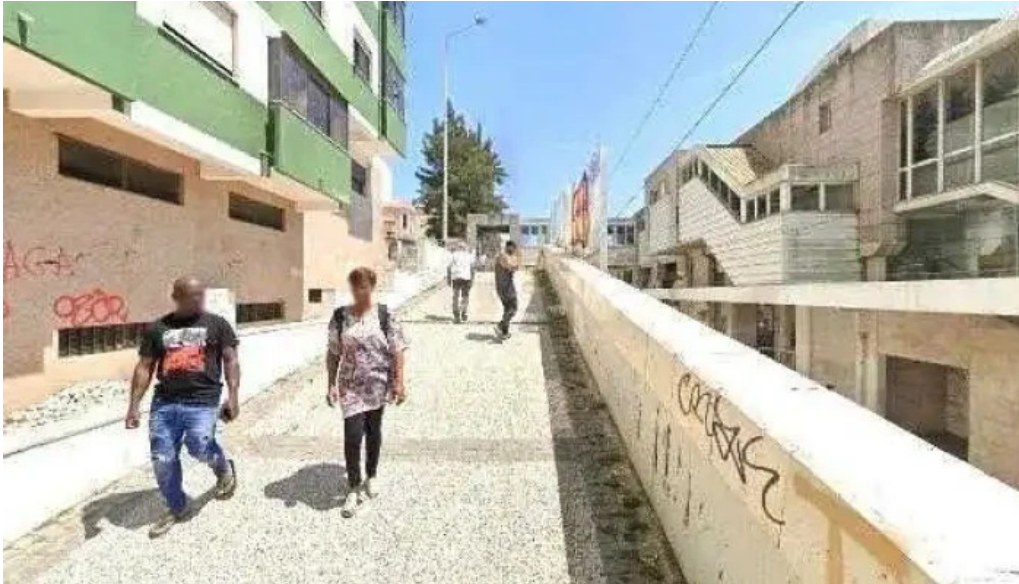
Loja ctt street view e 360deg