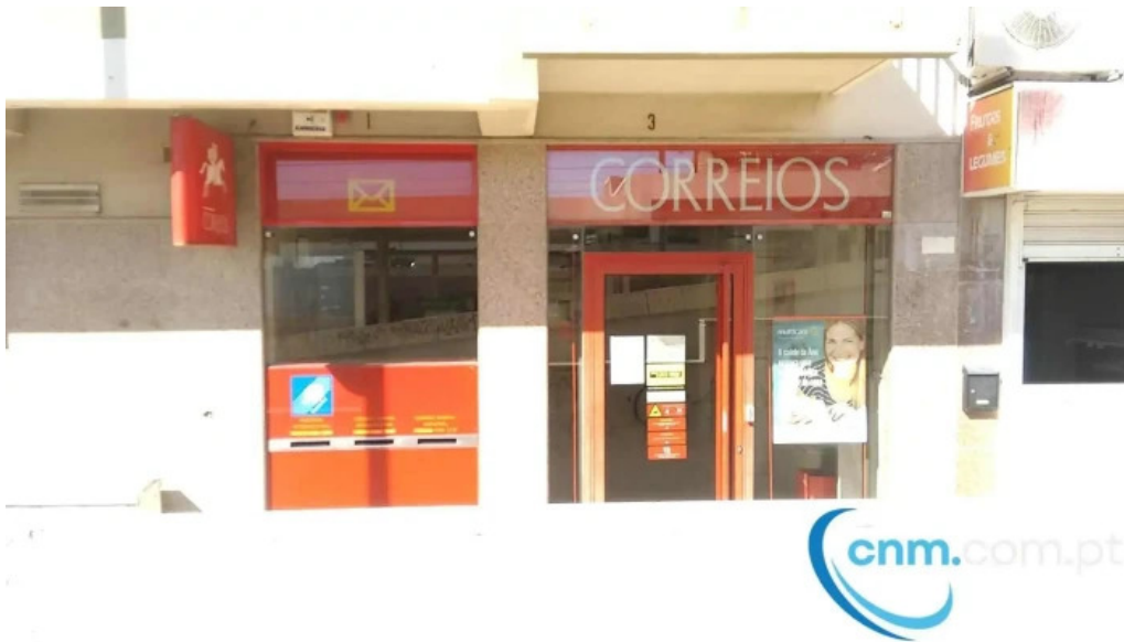
Loja ctt exterior