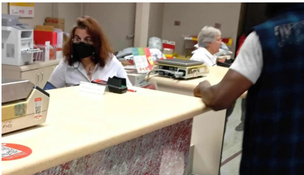
Loja ctt correios