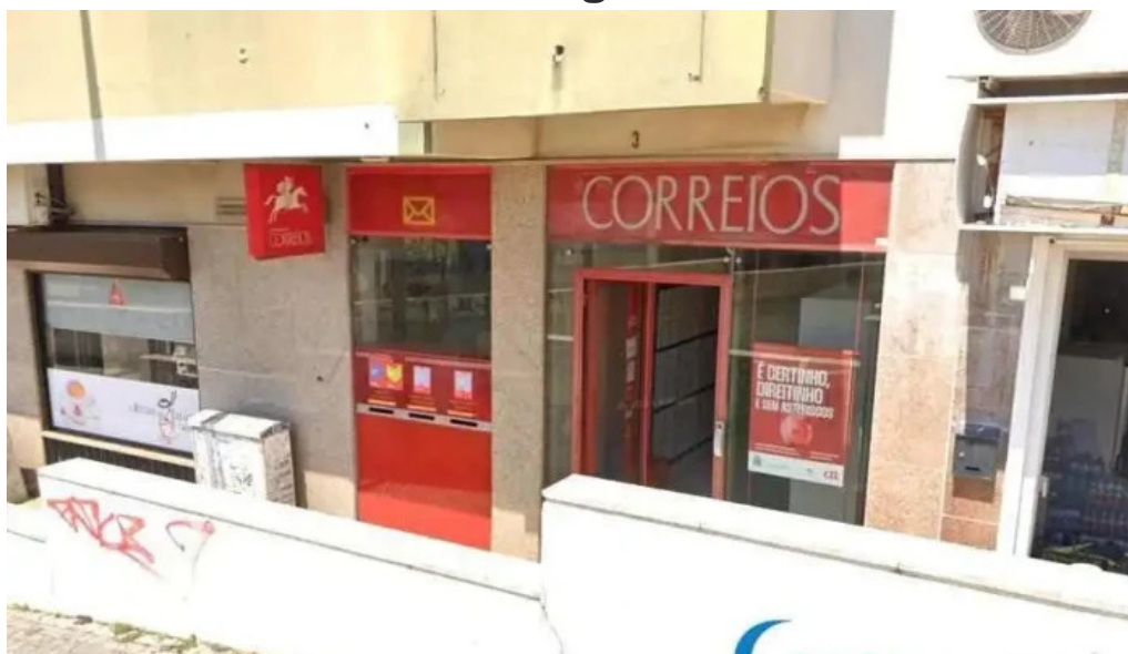
Loja ctt tudo