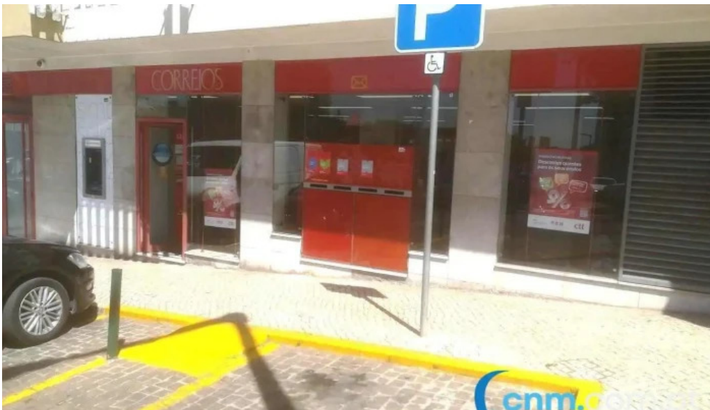
Loja ctt sao joao da talha