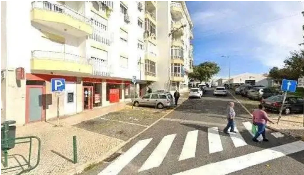
Loja ctt street view e 360deg