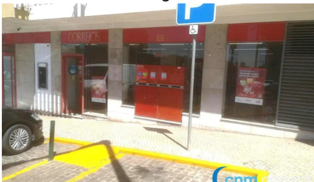
Loja ctt tudo