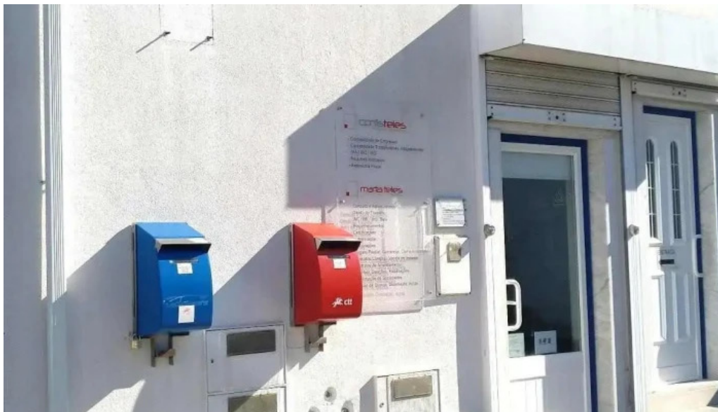
Estacao dos correios de s joao das lampas tudo