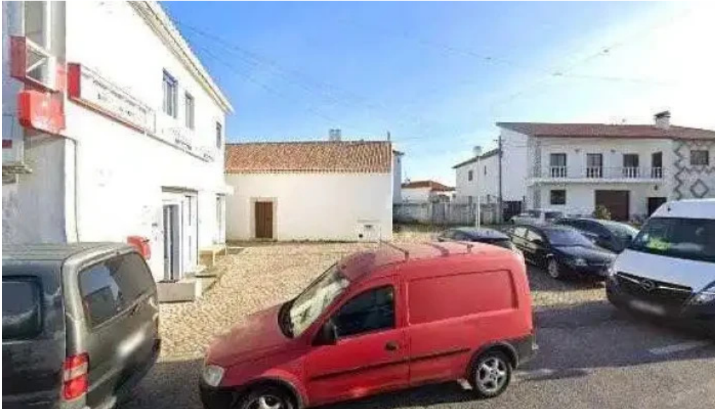
Estacao dos correios de s joao das lampas street view e 360deg