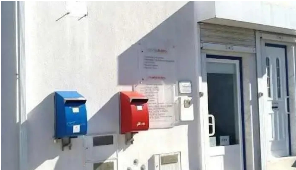
Estacao dos correios de s joao das lampas sao joao das lampas