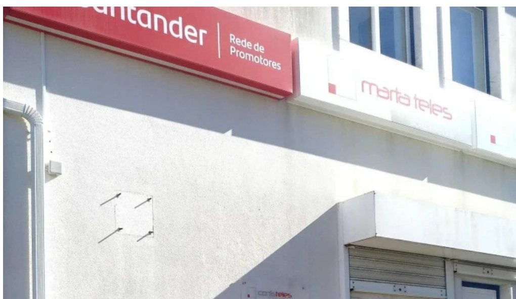
Estacao dos correios de s joao das lampas correios