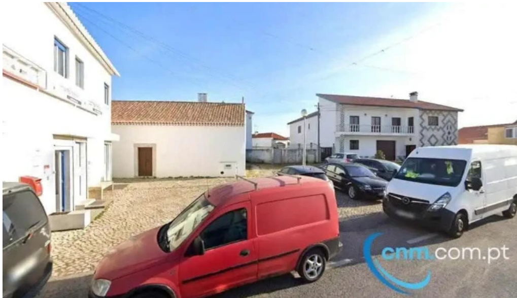
Ponto ctt sao joao das lampas