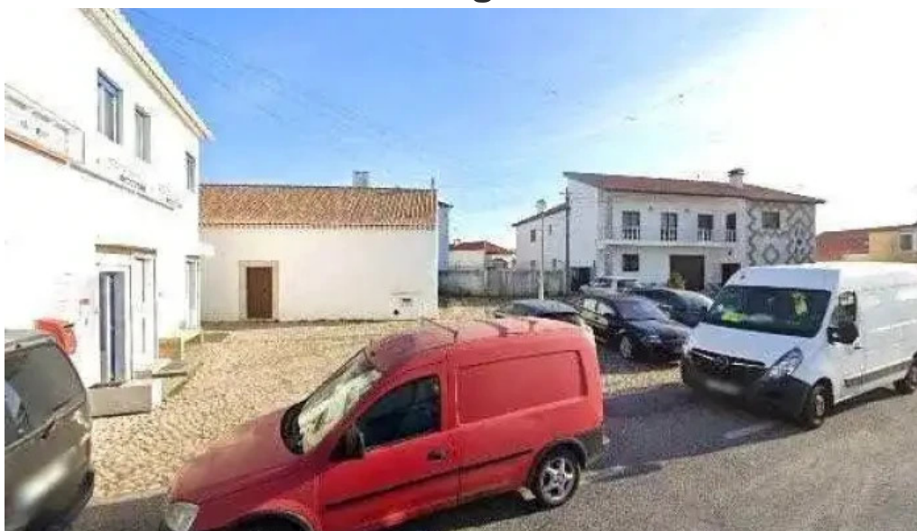
Ponto ctt tudo