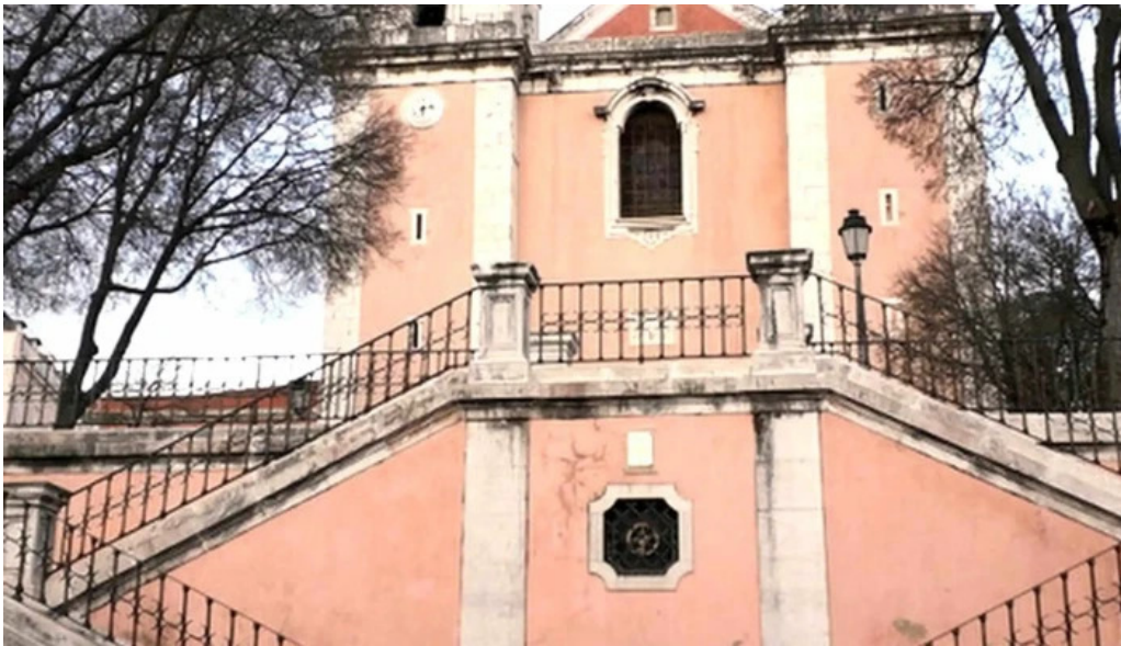
Igreja de santos o velho catalogo