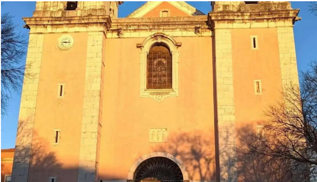
Igreja de santos o velho tudo