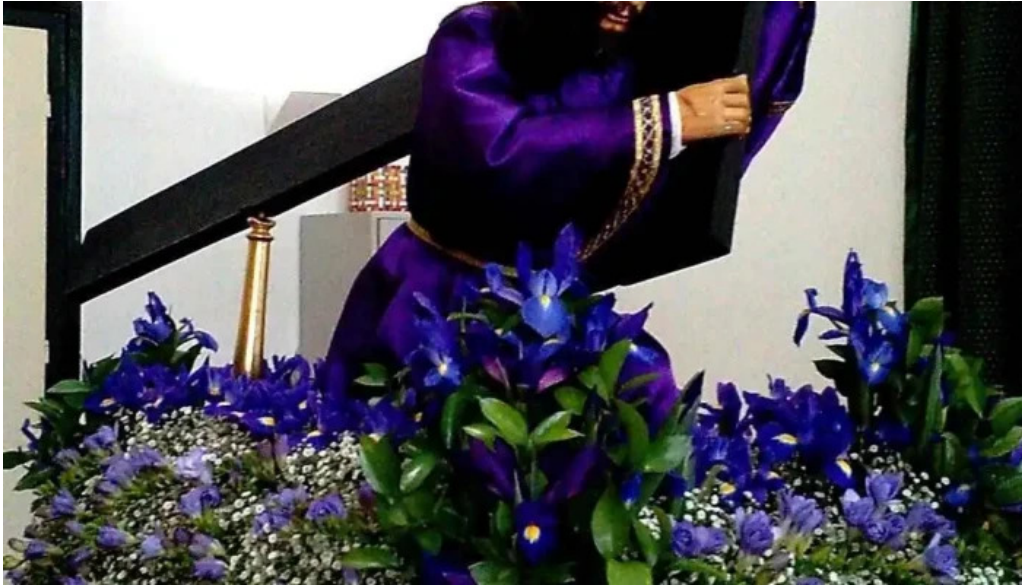
Igreja de santos o velho videos