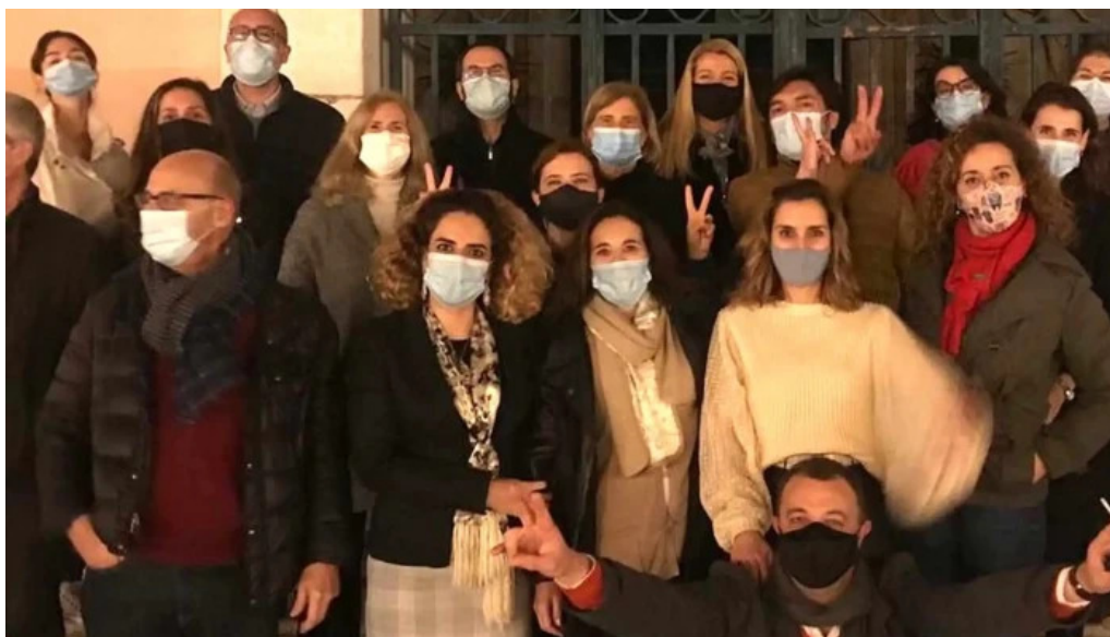
Igreja de santos o velho aberto agora