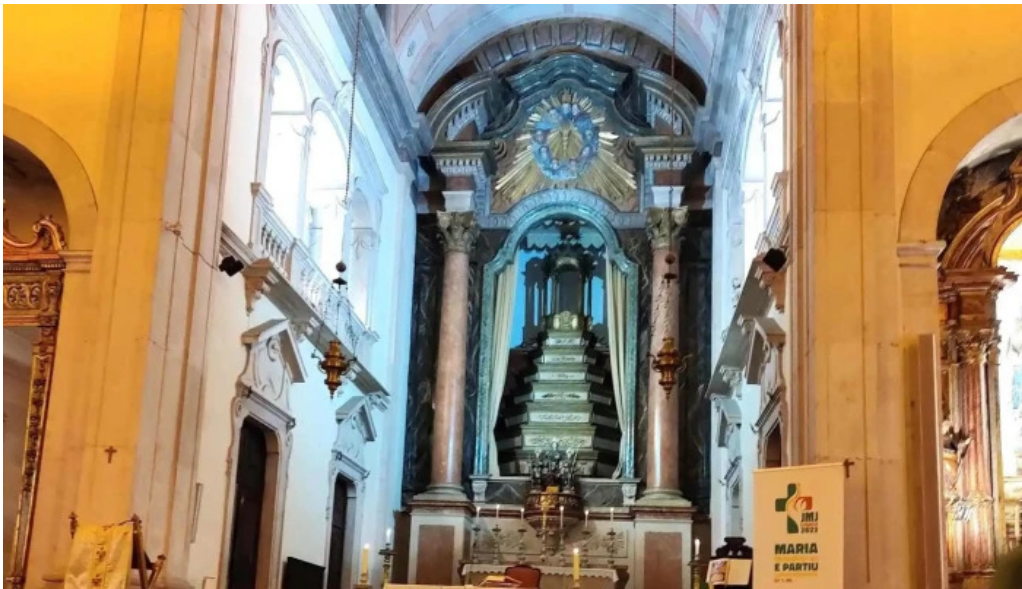
Igreja de santos o velho perto de mim