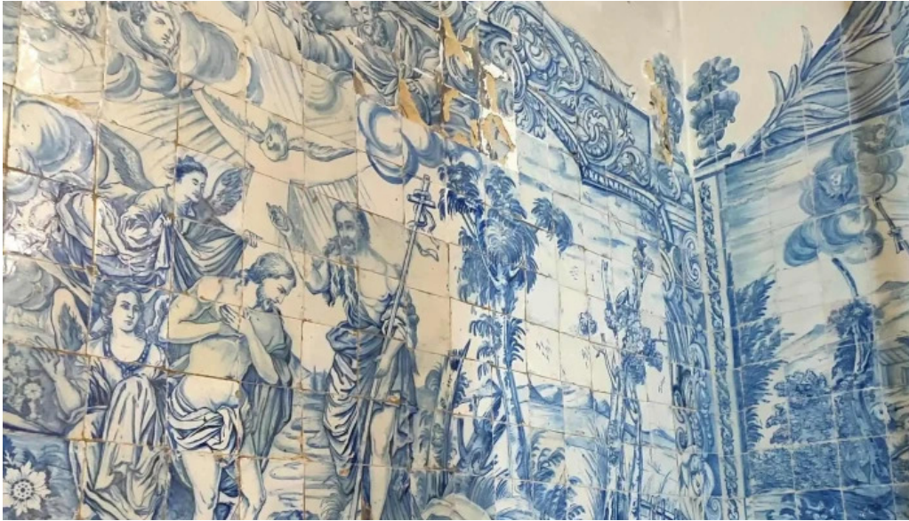
Igreja de santos o velho horario