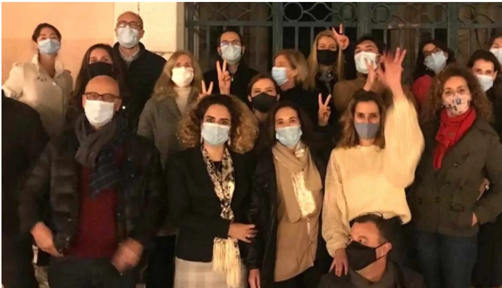
Igreja de santos o velho onde