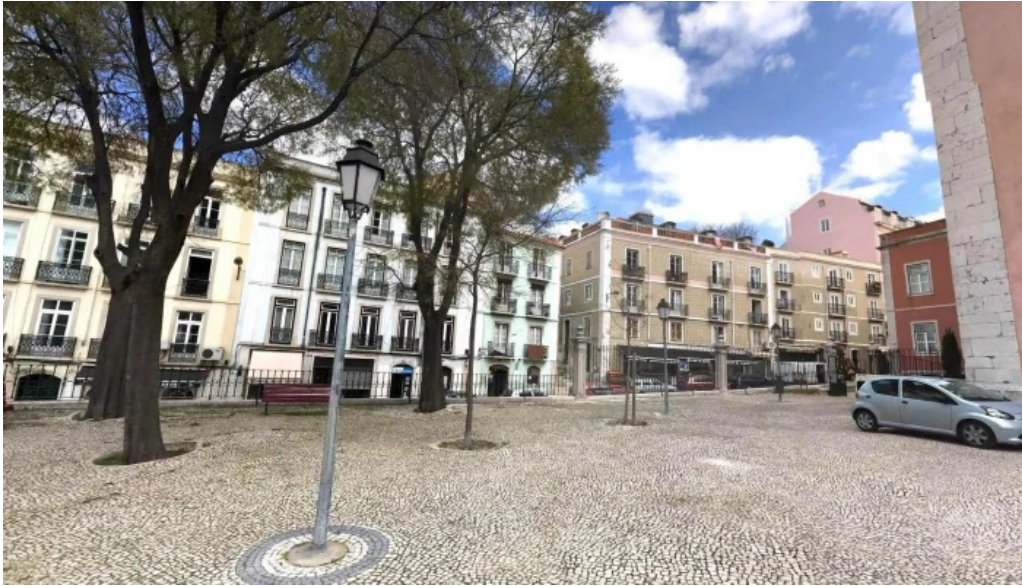
Igreja de santos o velho street view e 360deg