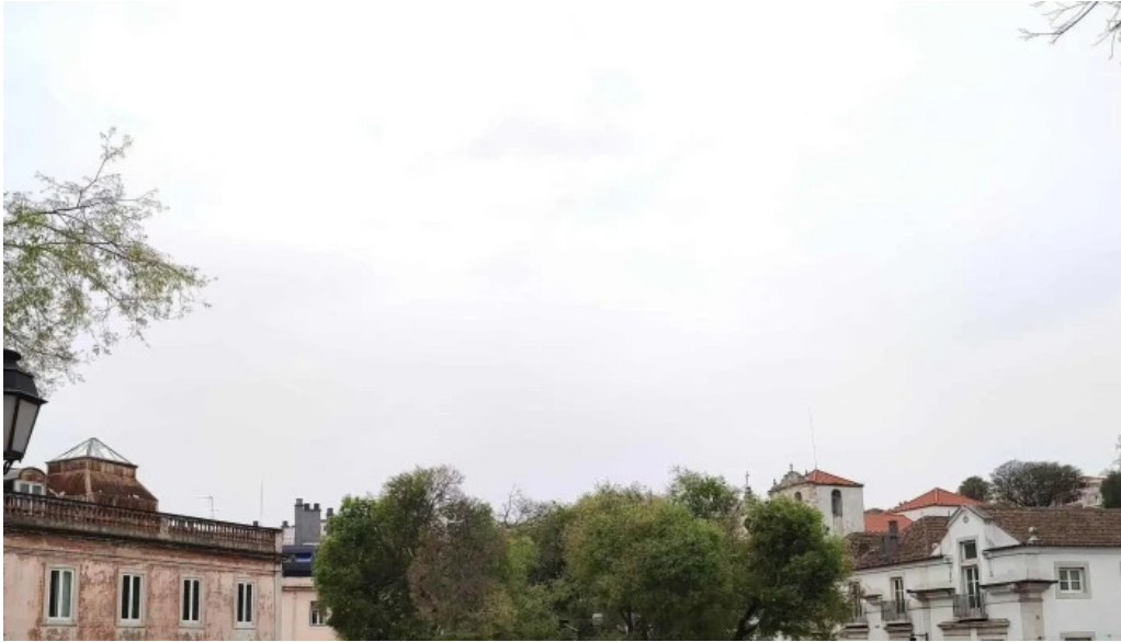
Igreja de santos o velho opinioes