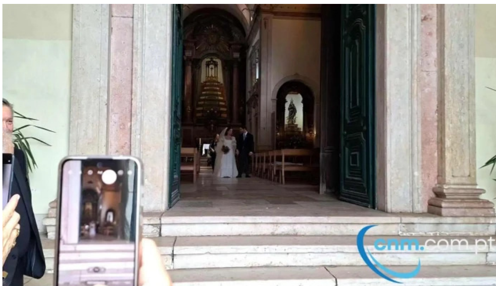
Igreja de santos o velho igreja