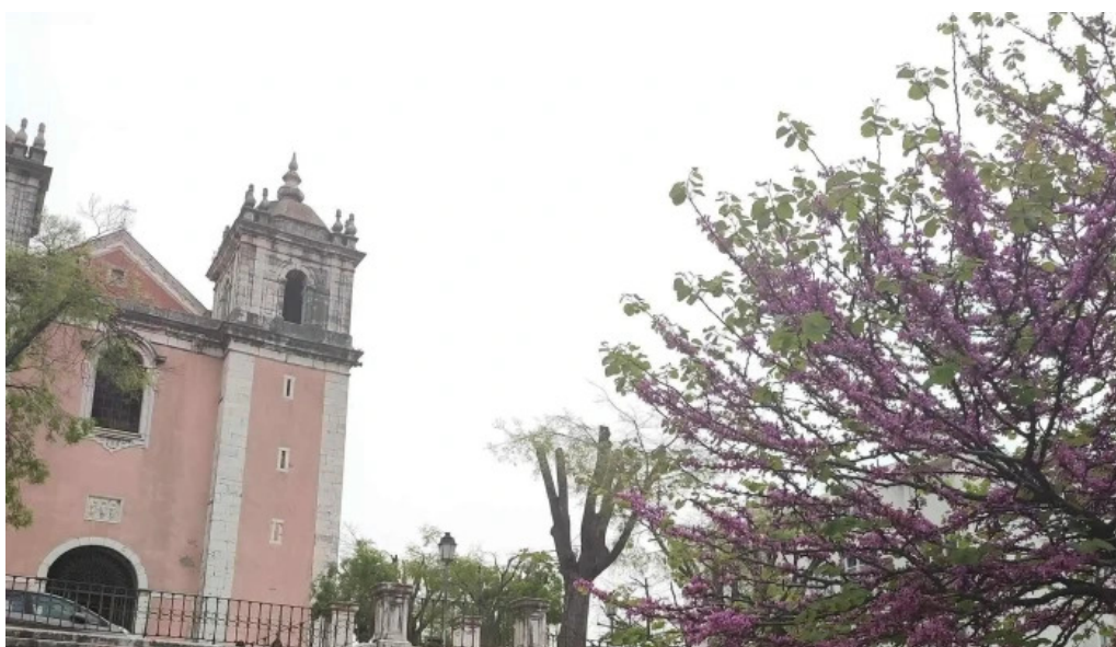
Igreja de santos o velho igreja catolica