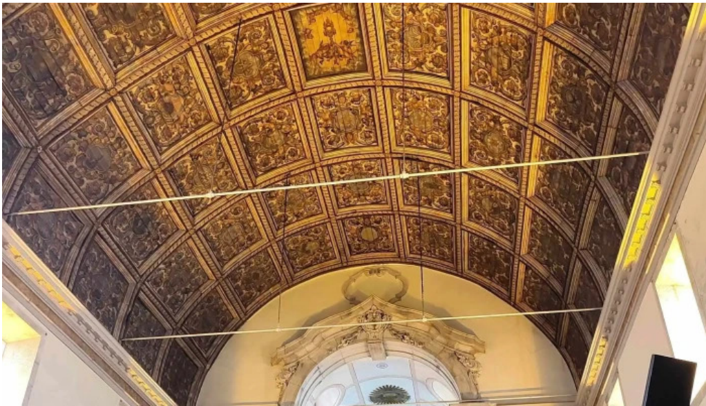
Igreja de santos o velho lisboa