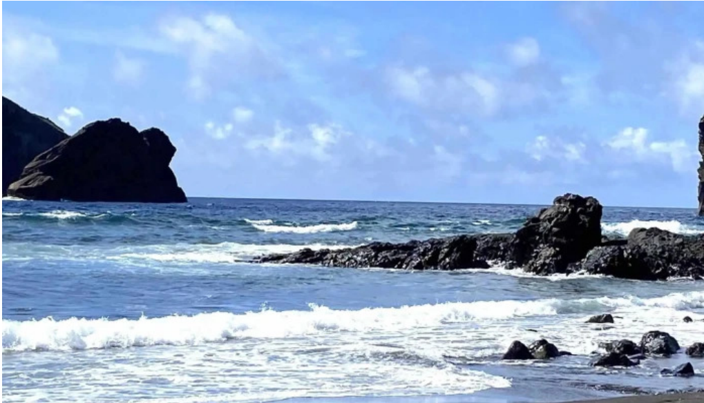
Praia dos mosteiros mosteiros