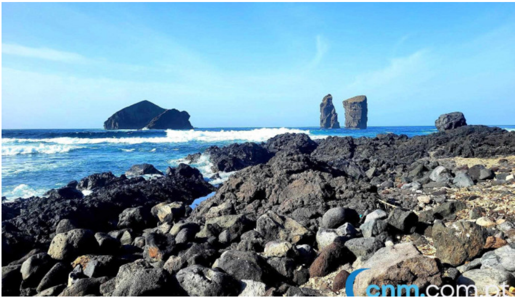
Praia dos mosteiros tudo