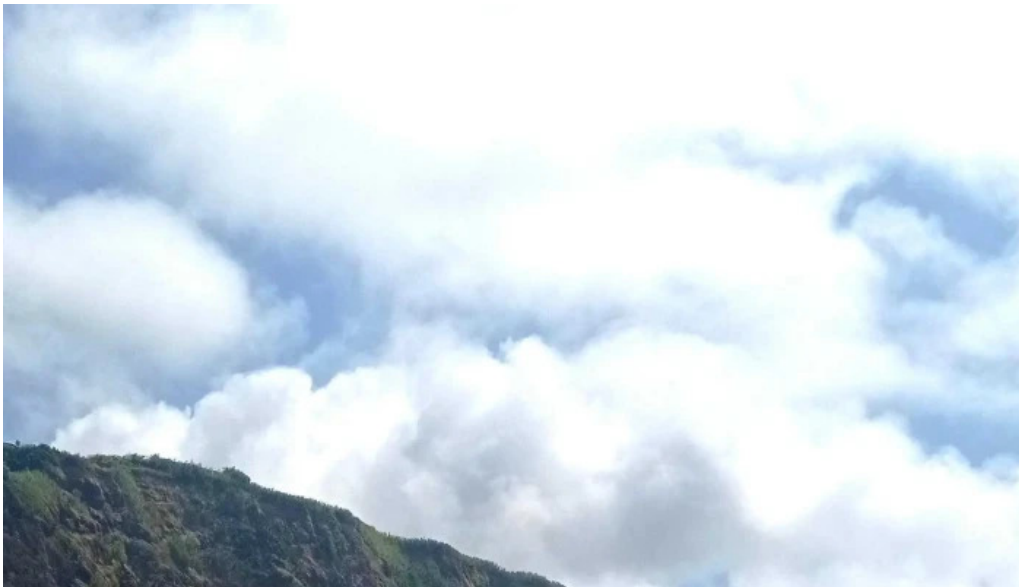
Praia dos mosteiros endereco