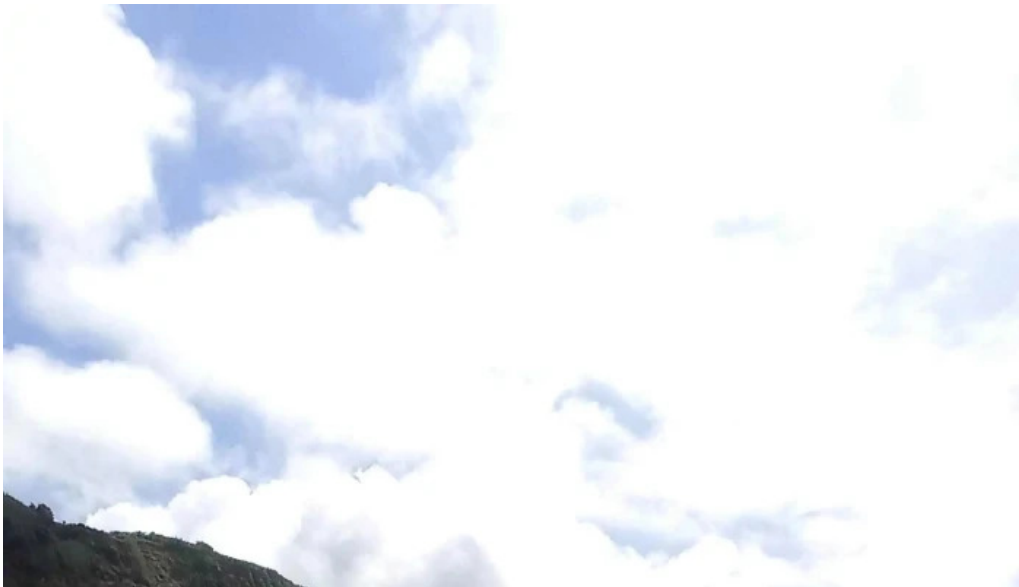
Praia dos mosteiros localizacao