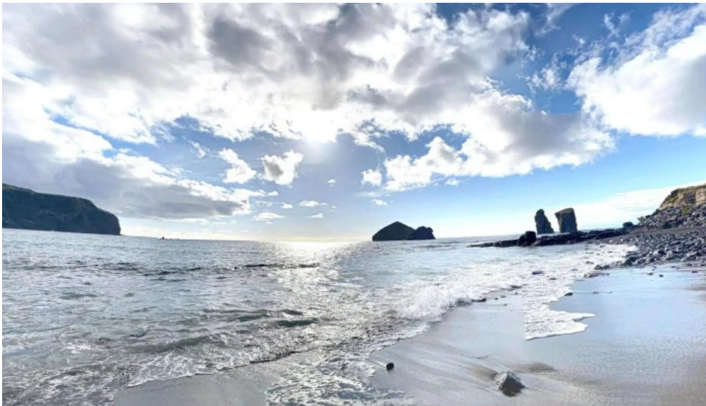
Praia dos mosteiros street view e 360deg