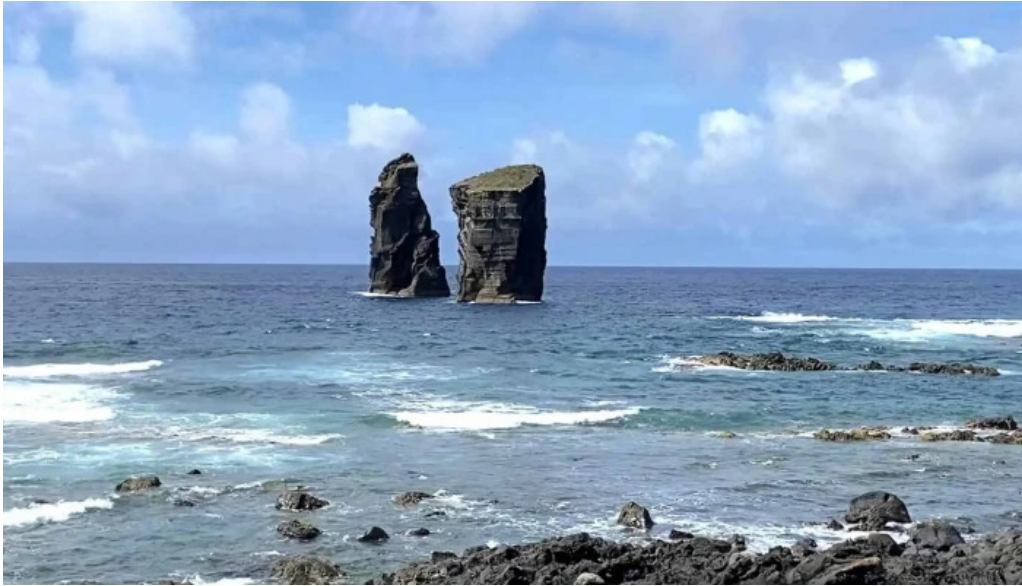
Praia dos mosteiros zona