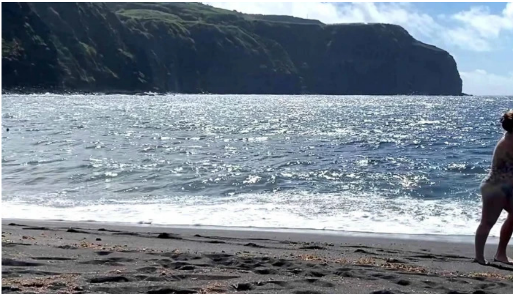
Praia dos mosteiros praia