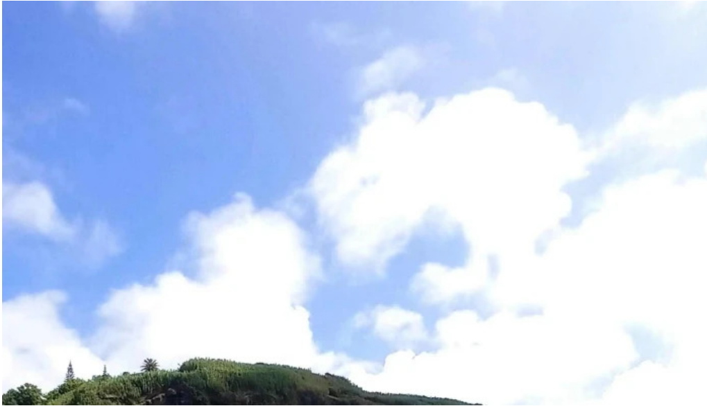
Praia dos mosteiros instagram