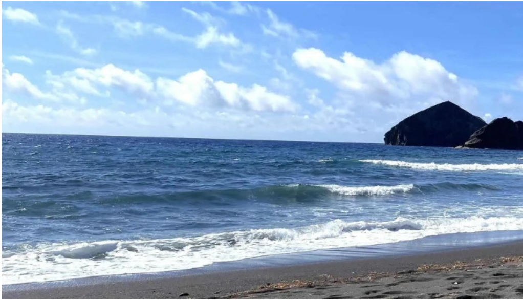
Praia dos mosteiros precos