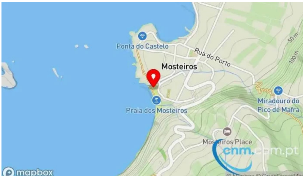
Praia dos mosteiros mapa