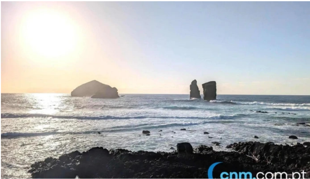
Praia dos mosteiros por do sol