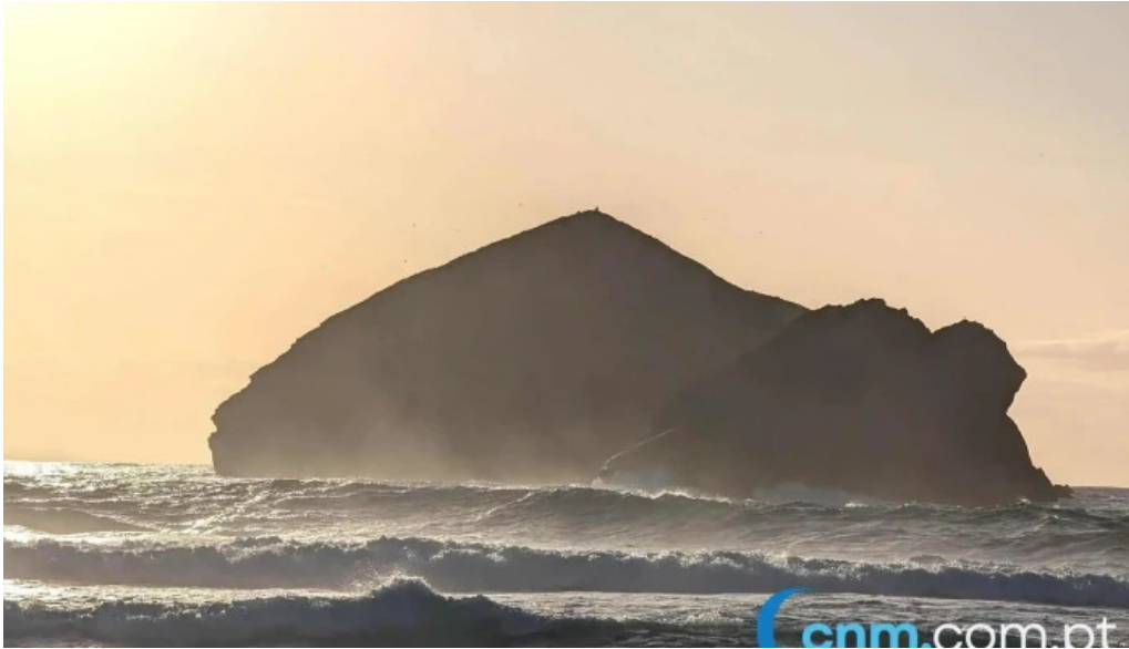
Praia dos mosteiros mais recentes